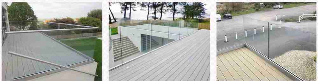
Ban công lan can kính với thiết kế không khung kênh U

Lan can kính nhiều lớp cường lực 5 + 1.14pvb + 5mm cho ban công không chỉ cung cấp lợi ích lắp đặt nhẹ, dễ dàng, mà nó còn có thể giúp bạn tận hưởng hàng rào an toàn nhất và thiết kế trang trí tuyệt vời. Nếu bạn đang sử dụng pvb màu hoặc in kỹ thuật số hoặc phương pháp khắc axit cho kính nhiều lớp 11.14mm, bạn có thể làm cho thiết kế lan can ban công của bạn độc đáo!