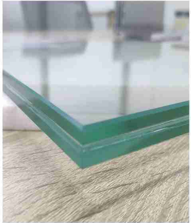
Mẫu ban công lan can kính