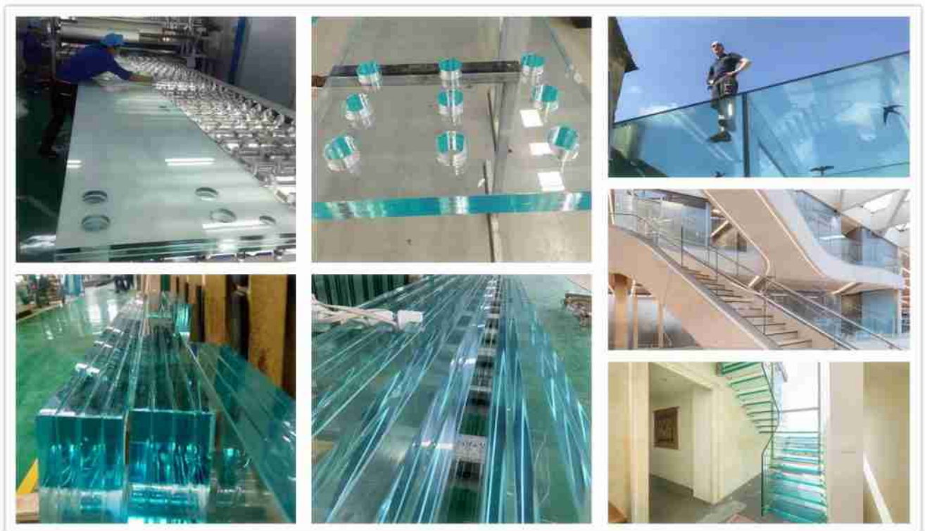
Các sản phẩm và ứng dụng kính SGP

□ độ truyền cao hơn, rõ ràng hơn : Chỉ số màu vàng của SGP nhỏ hơn 1,5 trong khi pvb là khoảng 6 ~ 12, có nghĩa là phim SGP có thể cung cấp độ truyền cao hơn, rõ ràng hơn nhiều và phong cảnh đẹp. SGP phim thường được kết hợp với kính thêm rõ ràng để nâng cao vẻ đẹp siêu rõ ràng của nó.