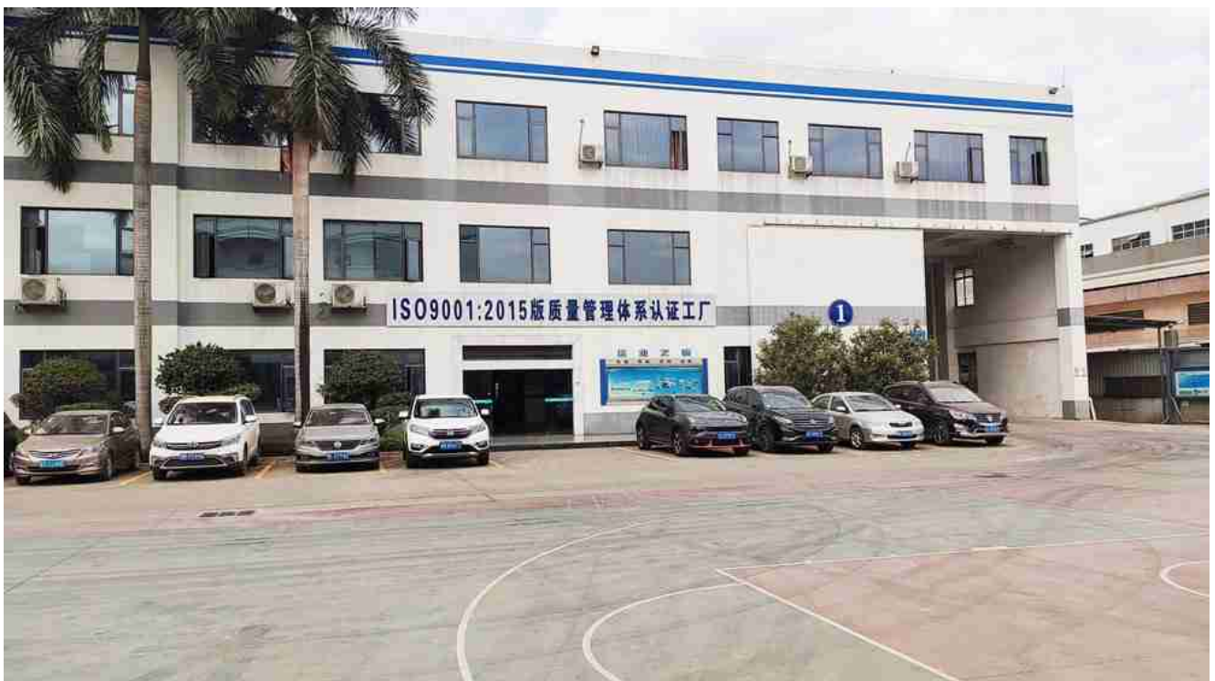
Một trong những nhà cung cấp kính SGP tốt nhất-Thâm Quyển Dragon Glass

Nói chung, giá kính SGP sẽ được giá trung bình tại Trung Quốc cho các nhà cung cấp để điều kiện, sự khác biệt duy nhất sẽ được về việc kiểm soát chất lượng xử lý. Hệ thống kiểm soát chất lượng của chúng tôi tốt hơn theo CE & tiêu chuẩn ASTM và do đó có thể đảm bảo chất lượng cao SGP kính sẵn sàng cho bạn. Các tệp chất lượng của chúng tôi có thể được gửi để bạn tham khảo nhằm giúp bạn tìm được nhà cung cấp kính SGP tốt.