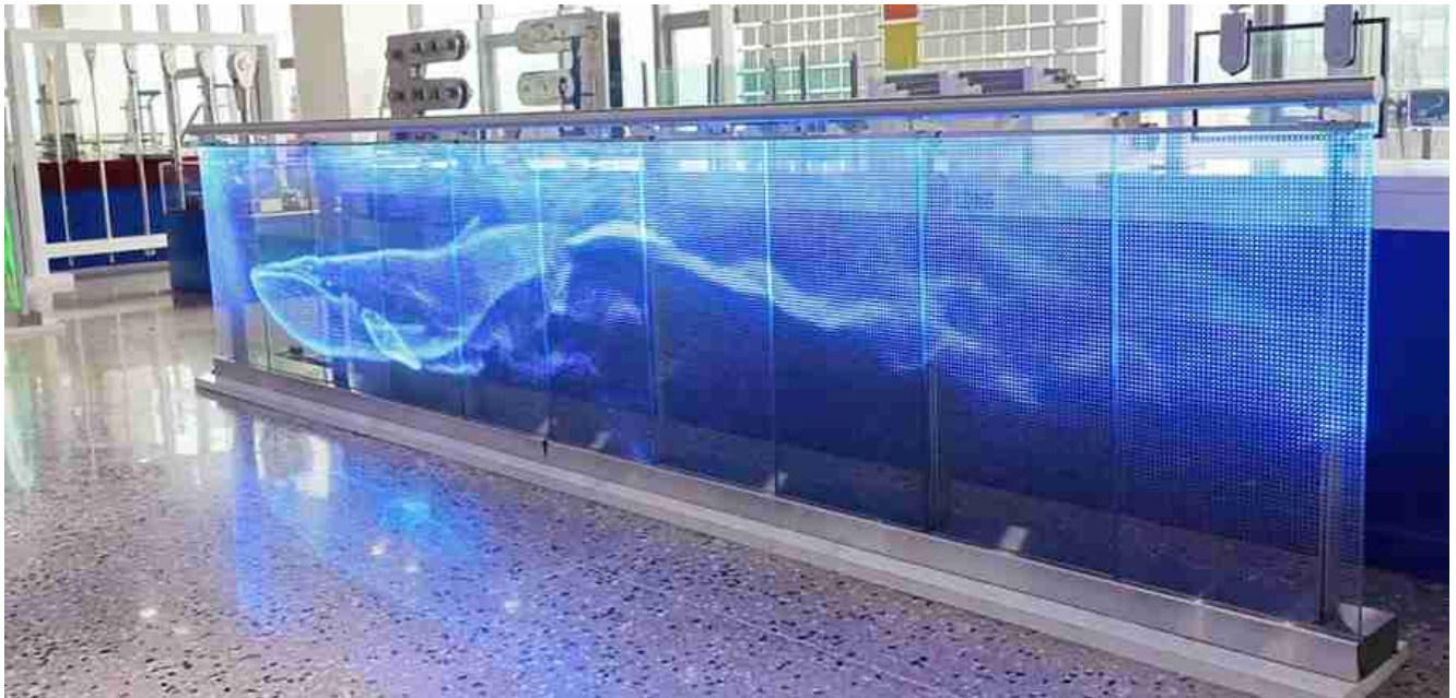
Kính nhiều lớp LED cho lan can