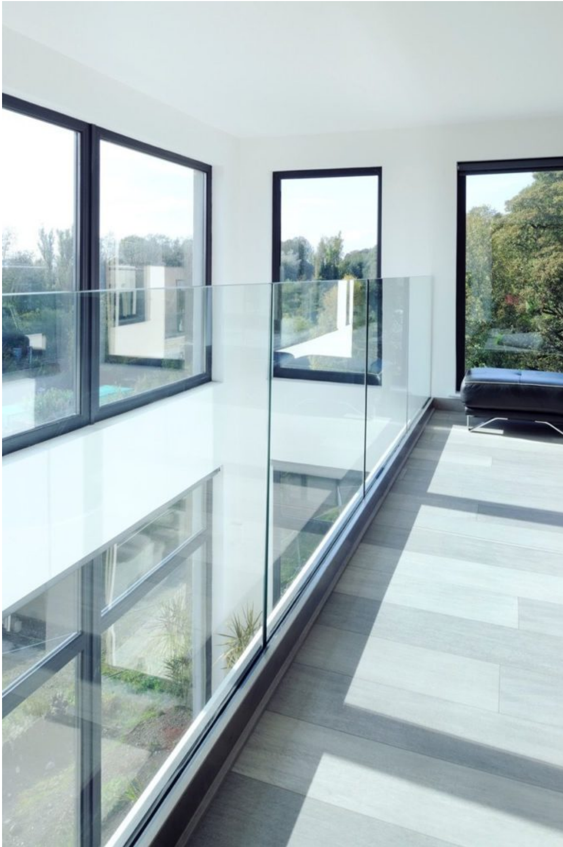
lan can nhôm kính không khung