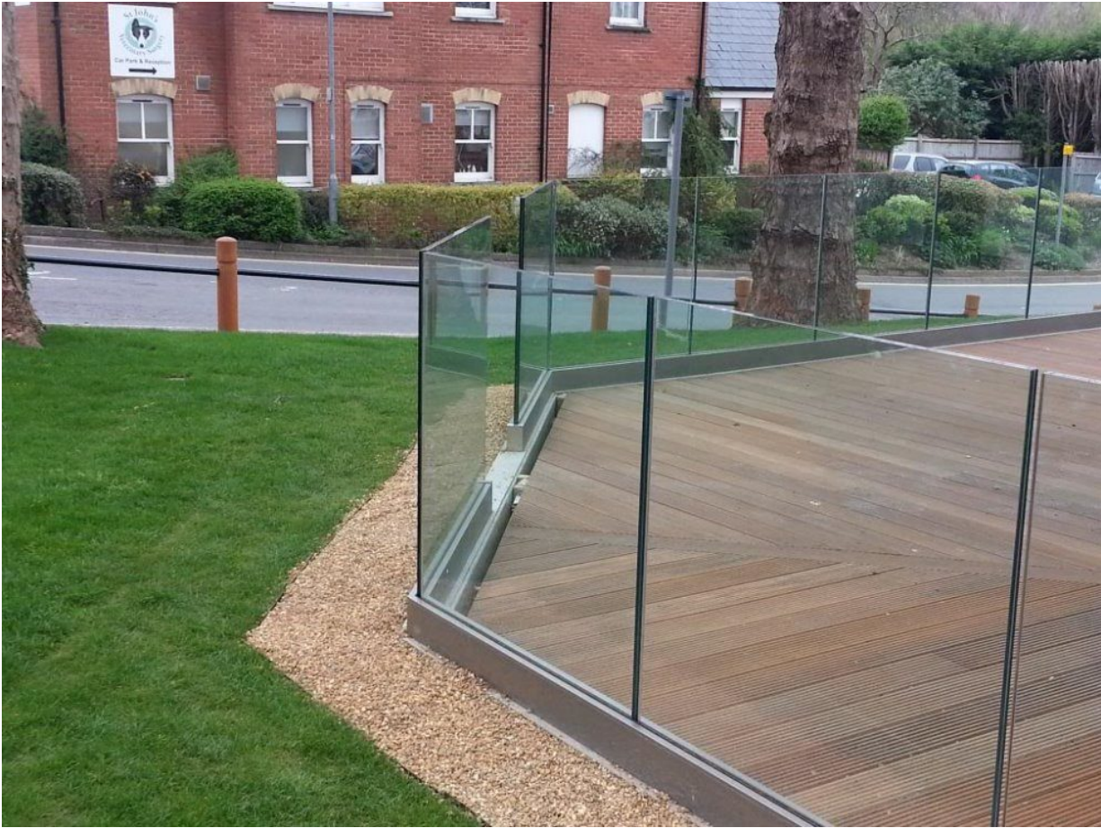
Lan can nhôm kính hàng rào sân

Thâm Quy  n Dragon Glass là một trong những nhà s  n xu  t lan can kính hàng đ  u , chuyên s  n xu  t các loại lan can kính ch  t lượng cao. Hãy liên hệ với chúng tôi ngay hôm nay đ   được gi  i đáp th  c m  c mi  n phí và nhận ưu đ  i t  t nh  t .