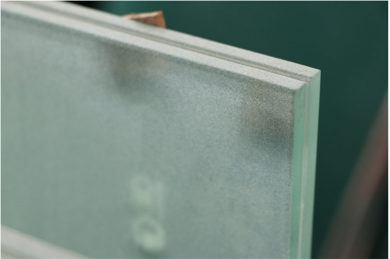
kính nhũu lớp phun cát