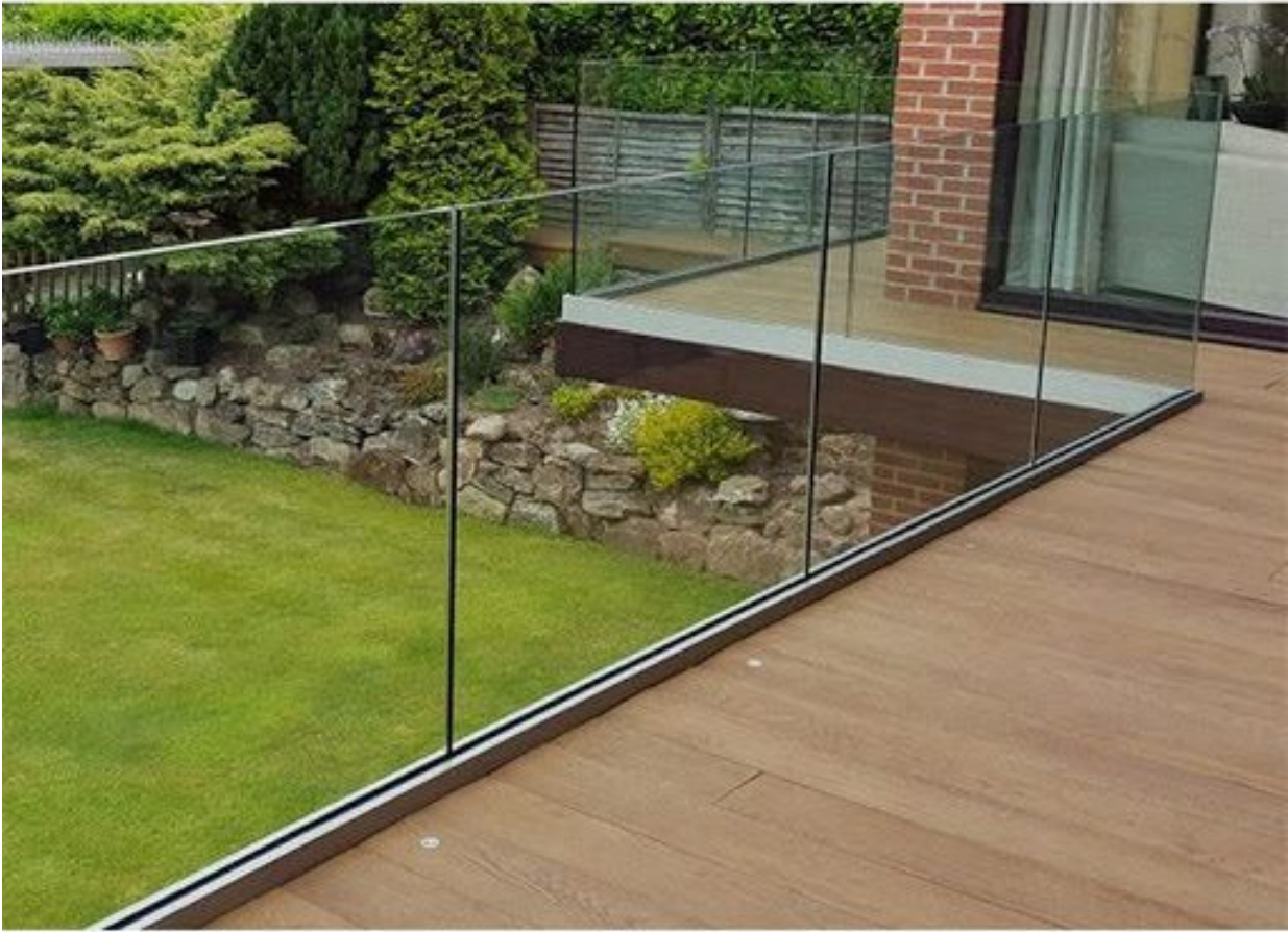
lan can kính ban công hiện đại