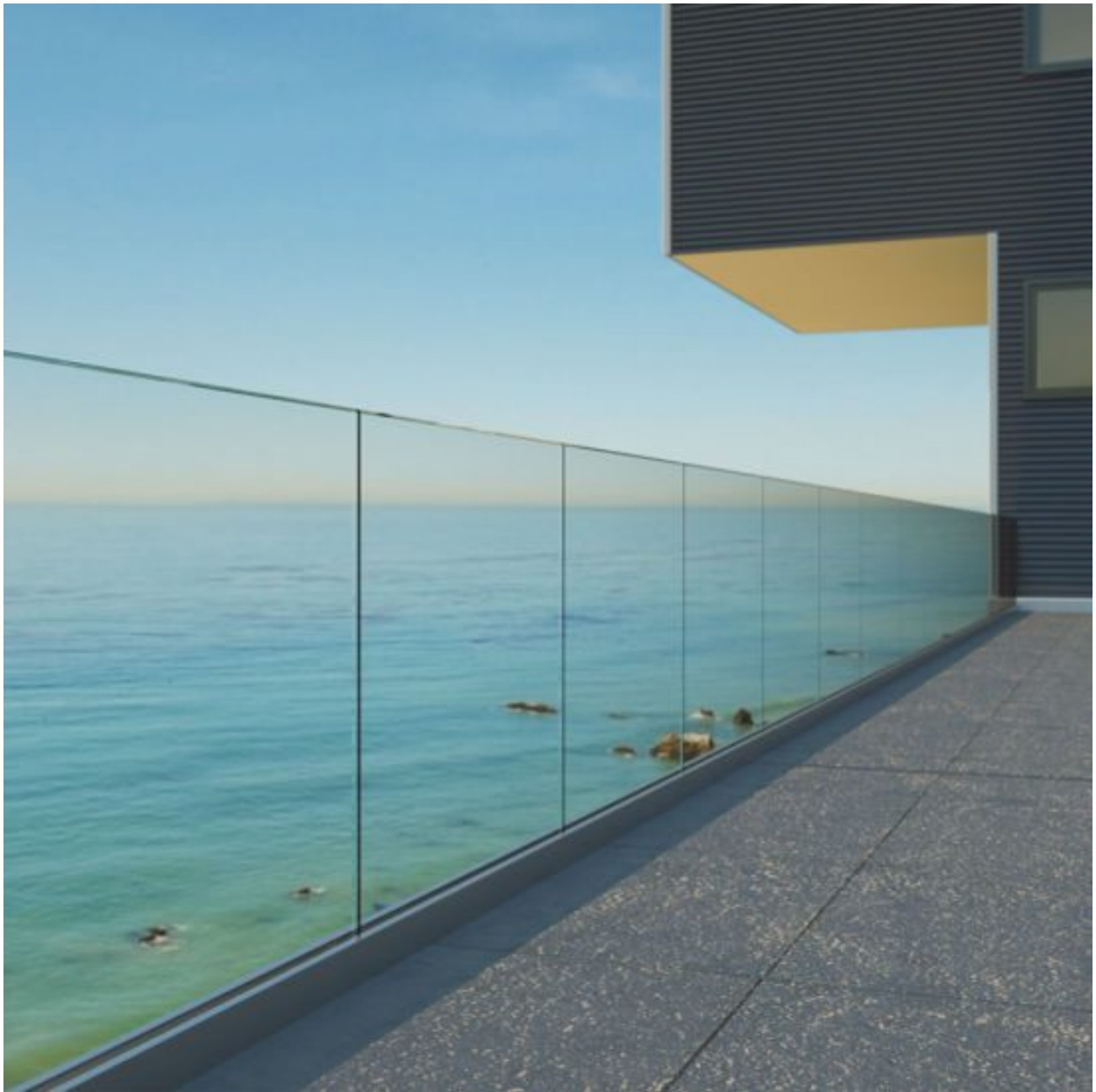
lan can nhôm kính biển