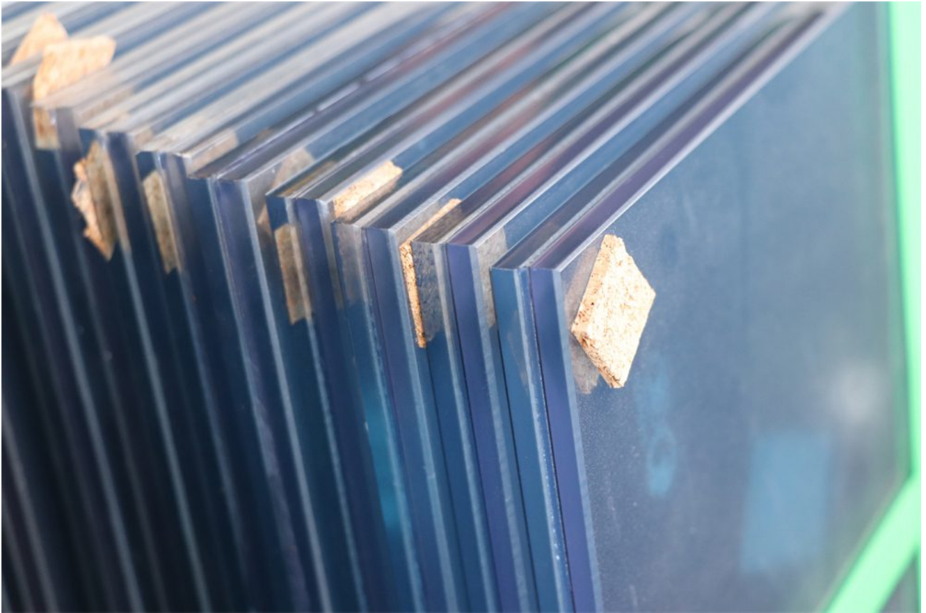
kính nhi ều lớp màu xanh