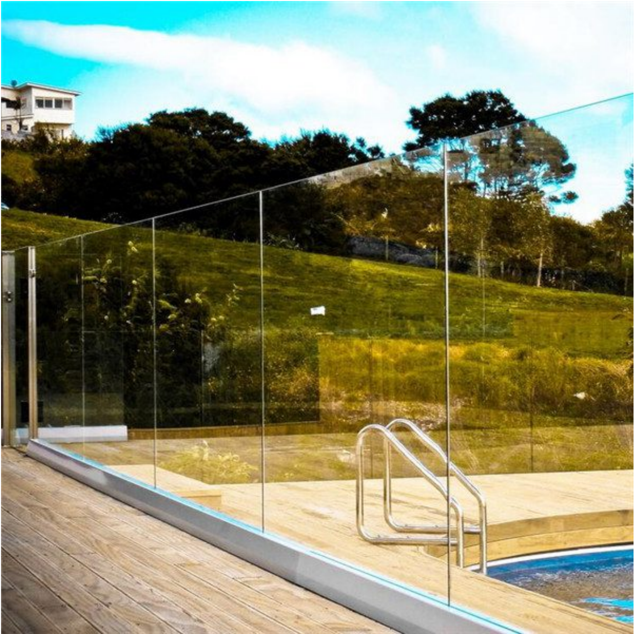
Lan can nhôm kính làm hàng rào