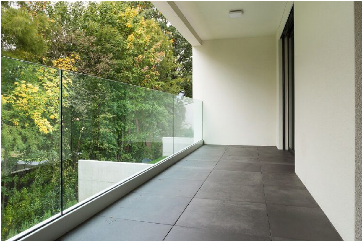
lan can kính ban công hiện đại