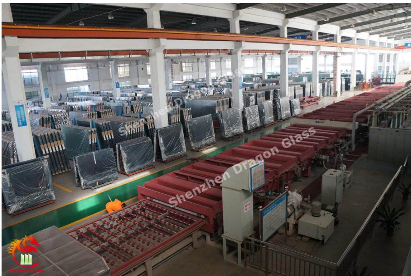
Линия по производству стекла Low-E и светоотражающего стекла

более 2000 квадратных метров. Мы можем собрать двойное остекление Low-E в течение 24 часов, избегая окисления слоя покрытия Low-E.