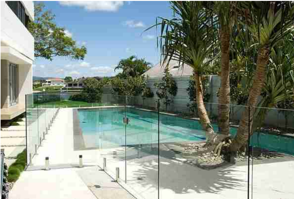
Стеклянное ограждение для бассейнов