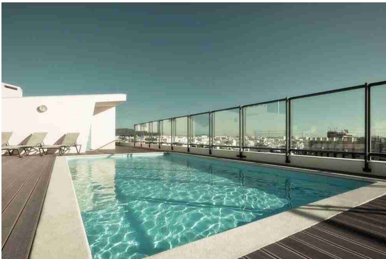
Стекло для фехтования у бассейна

Используя 12-мм закаленное стеклянное ограждение для бассейнов, вы можете не только наслаждаться хорошим плаванием, солнцем, сладким и мягким бризом, но и хорошим видом на пейзажи снаружи вокруг.