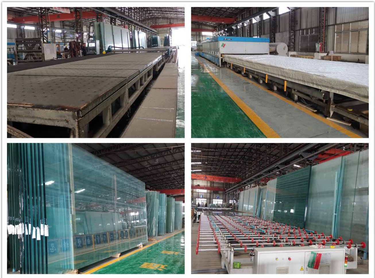
производственные машины и сырье больших размеров