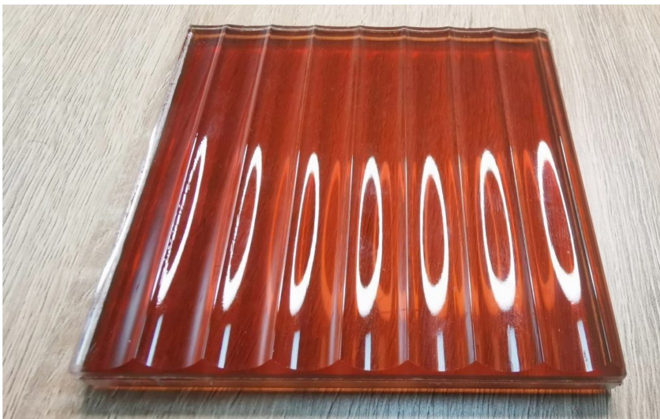
Бронзовый рифленый дизайн ламинирования стекла