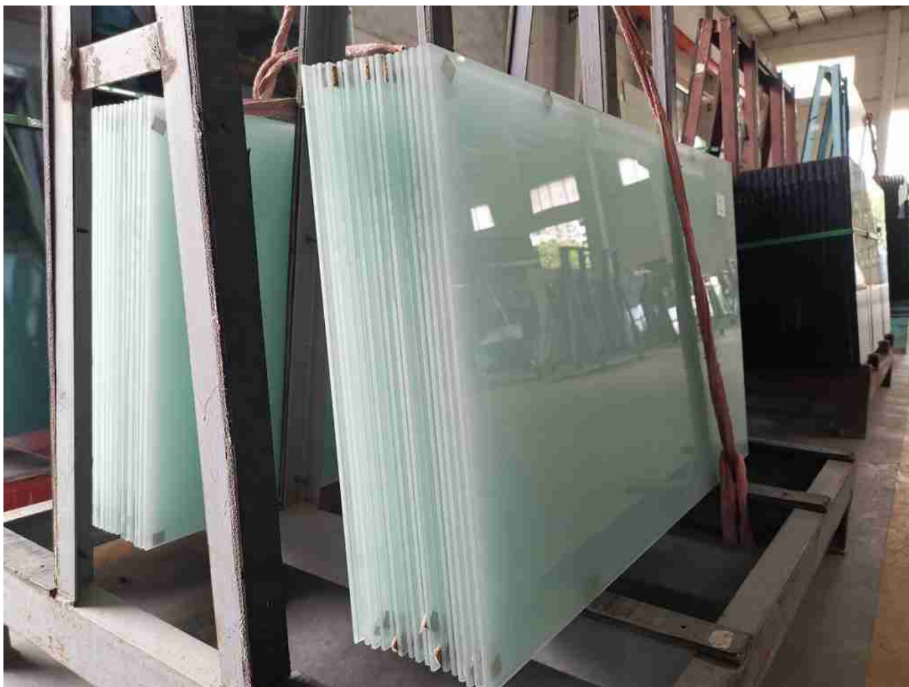
Пескоструйное стекло для матового эффекта.

The lamination undergoing a high temperature and high pressure in an autoclave finally result in permanent combinations of the glass and PVB material. Of course, if you need to ensure higher strength and better safety, you can adopt an SGP interlayer . But if you need to have mesh or wire to be laminated inside the laminated glass, you could use EVA interlayer , normally this will be adopted in interior designs products.