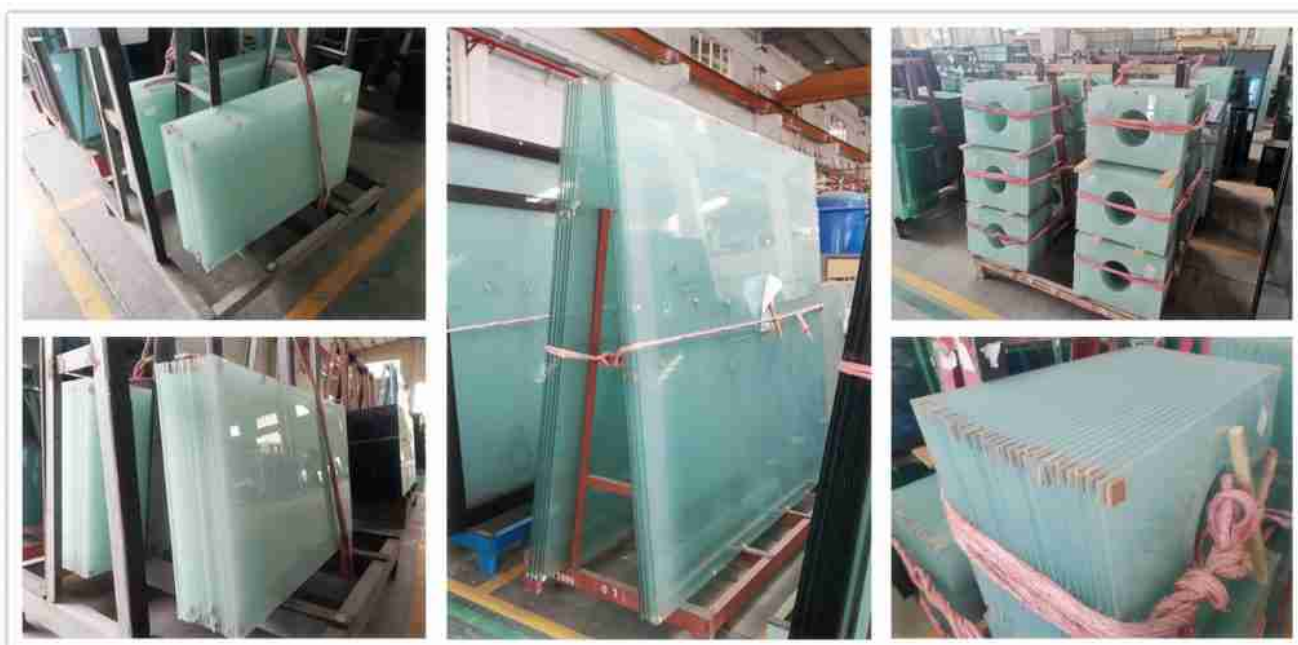
Матовое безопасное стекло