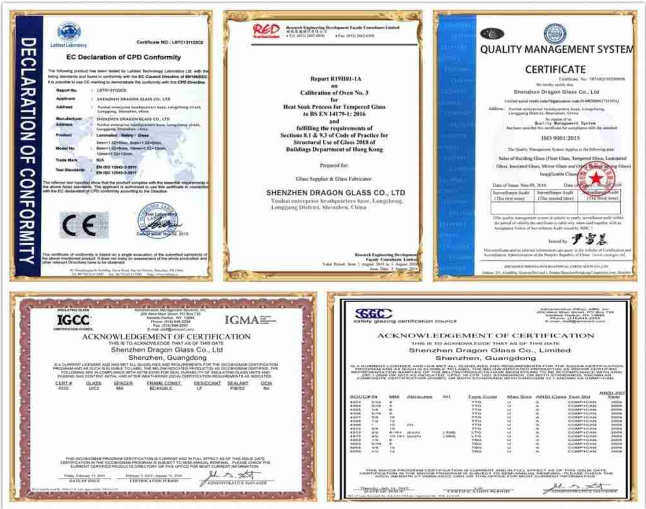
Шэньчжэнь Дракон стекла сертификаты