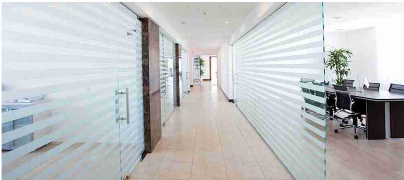
Песочное стекло для украшения перегородки