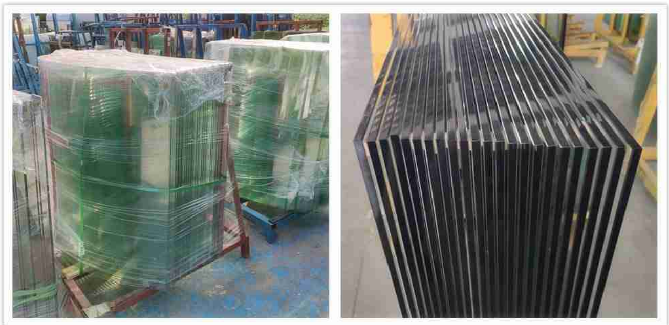
Vidro temperado curvo VS vidro temperado plano