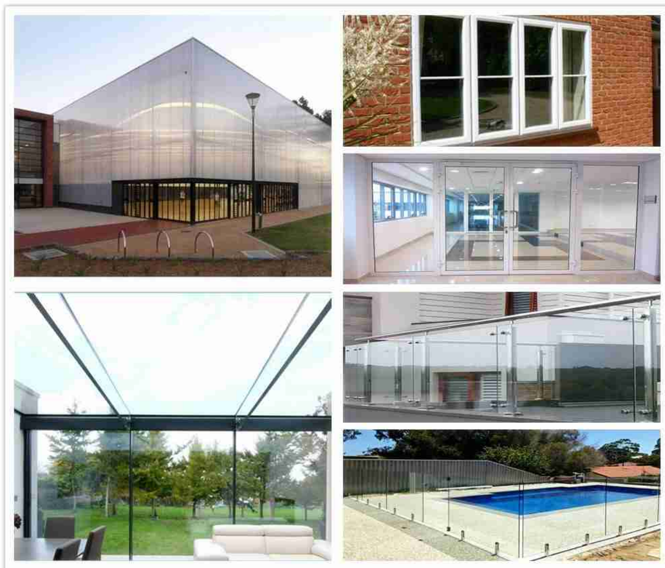
Aplicações de vidro temperado

Vidro flutuante totalmente temperado tem função de segurança e super alta resistência, portanto a maioria dos projetos de construção como fachada, grade, janelas, portas, chuveiro, vitrine, etc. vai adotá-lo.