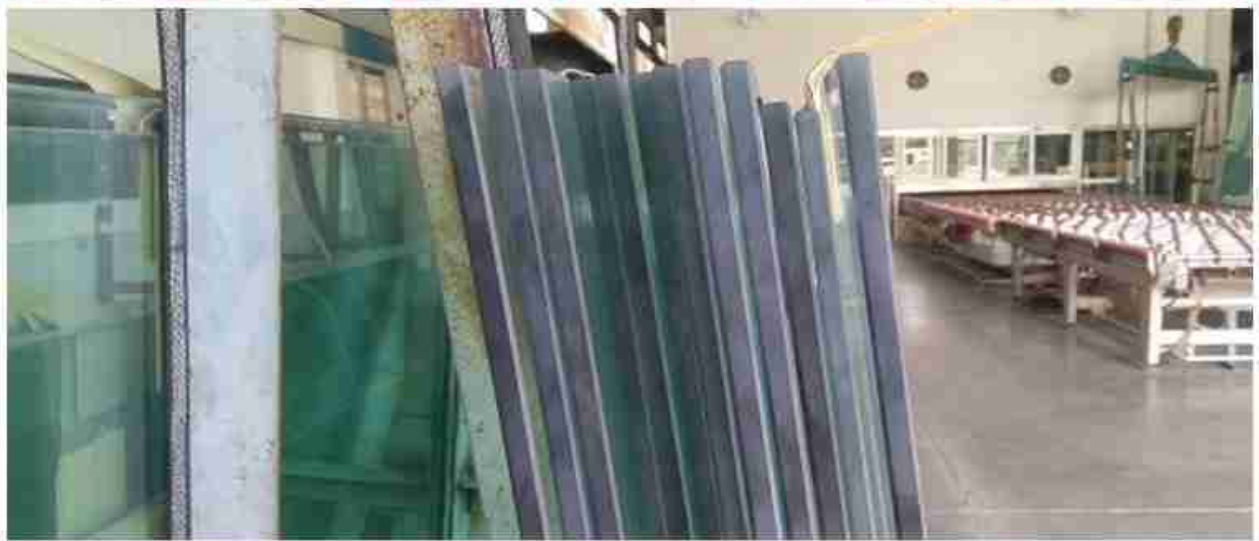
Vidro temperado bem polido VS vidro temperado polido mate: