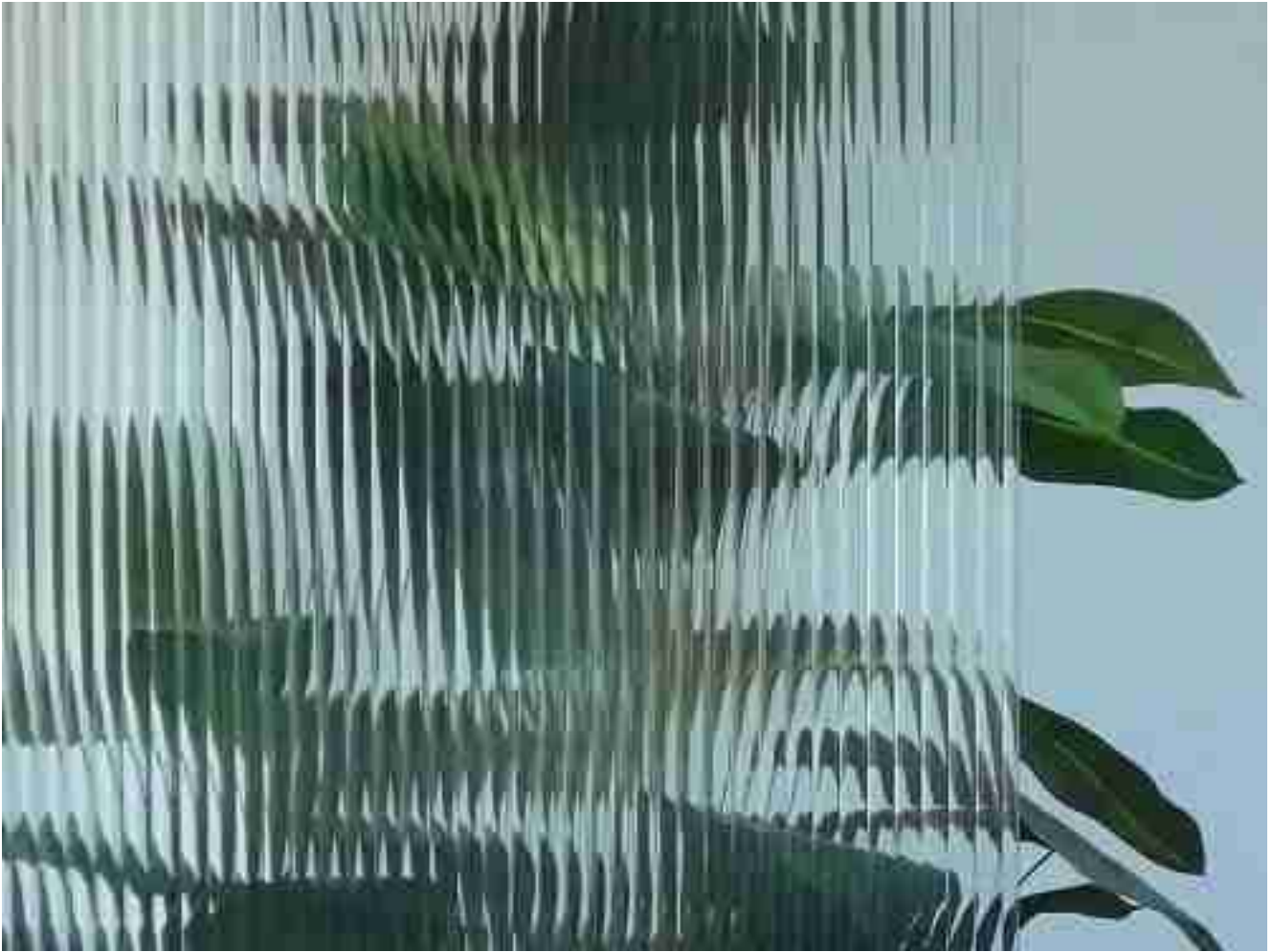
efeito de vidro costelado