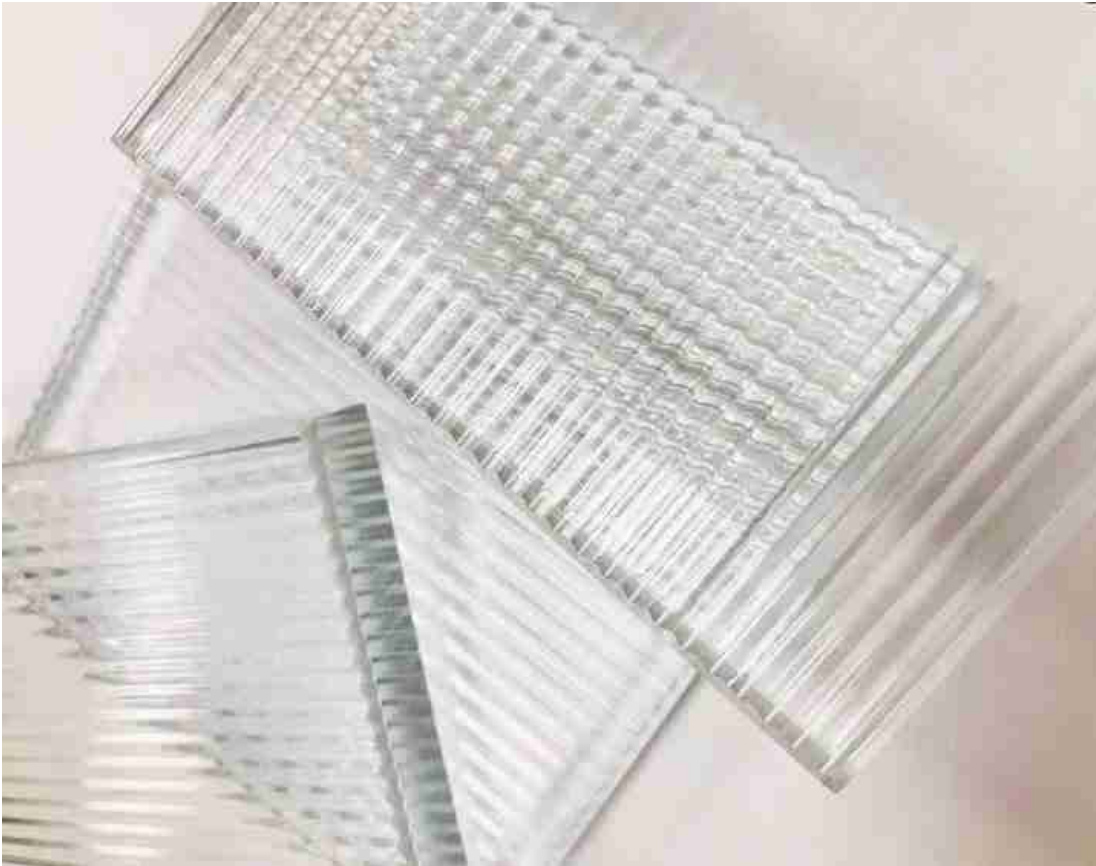
Vidro com costelas de 8mm