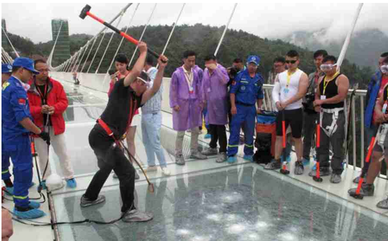
Piso de vidro laminado SGP suportando testes de impacto forte

Com múltiplas camadas de vidro laminado para o chão, ele pode suportar um impacto extremamente alto e permanecer ininterrupto. Se você usar vidro laminado SGP para piso, a força aumentará 5 vezes mais.