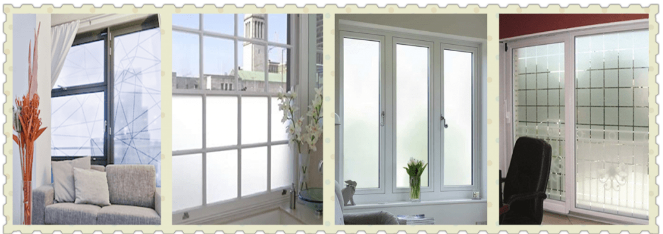
Janelas de gás