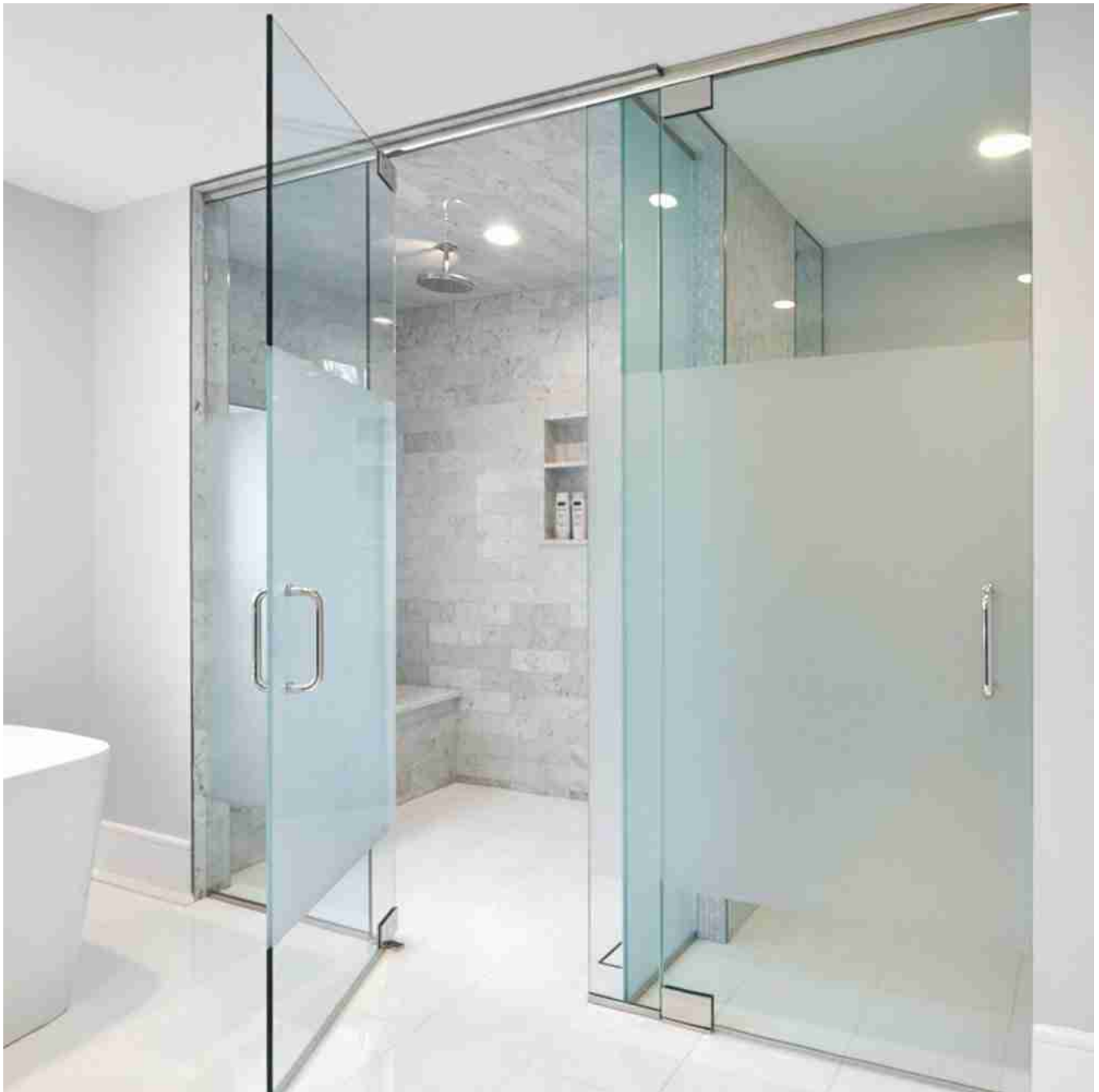
Portas de chuveiro

Com sua função exclusiva de manutenção de privacidade e efeito de decoração, o vidro jateado é amplamente utilizado em projetos de interiores como: