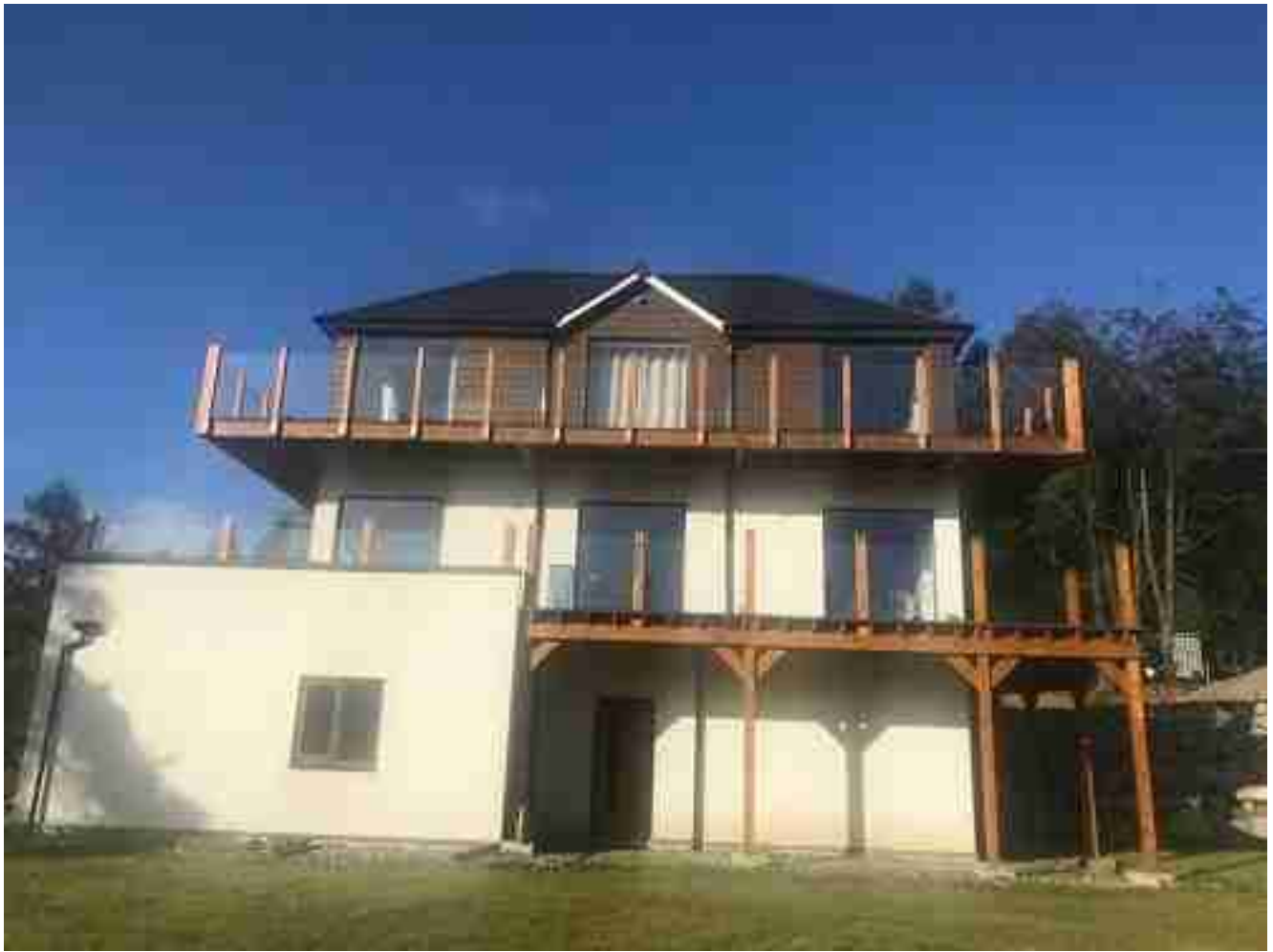
Corrimão de vidro de armação para varanda corrimão de vidro sem moldura para varanda.