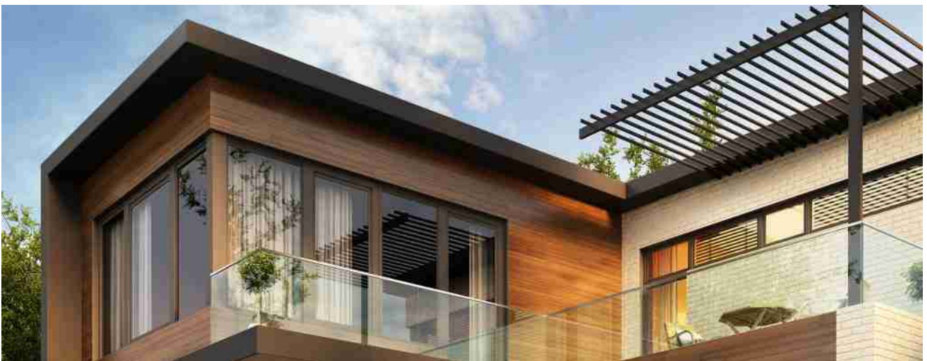
Vidro temperado laminado de vidro para preço de varanda