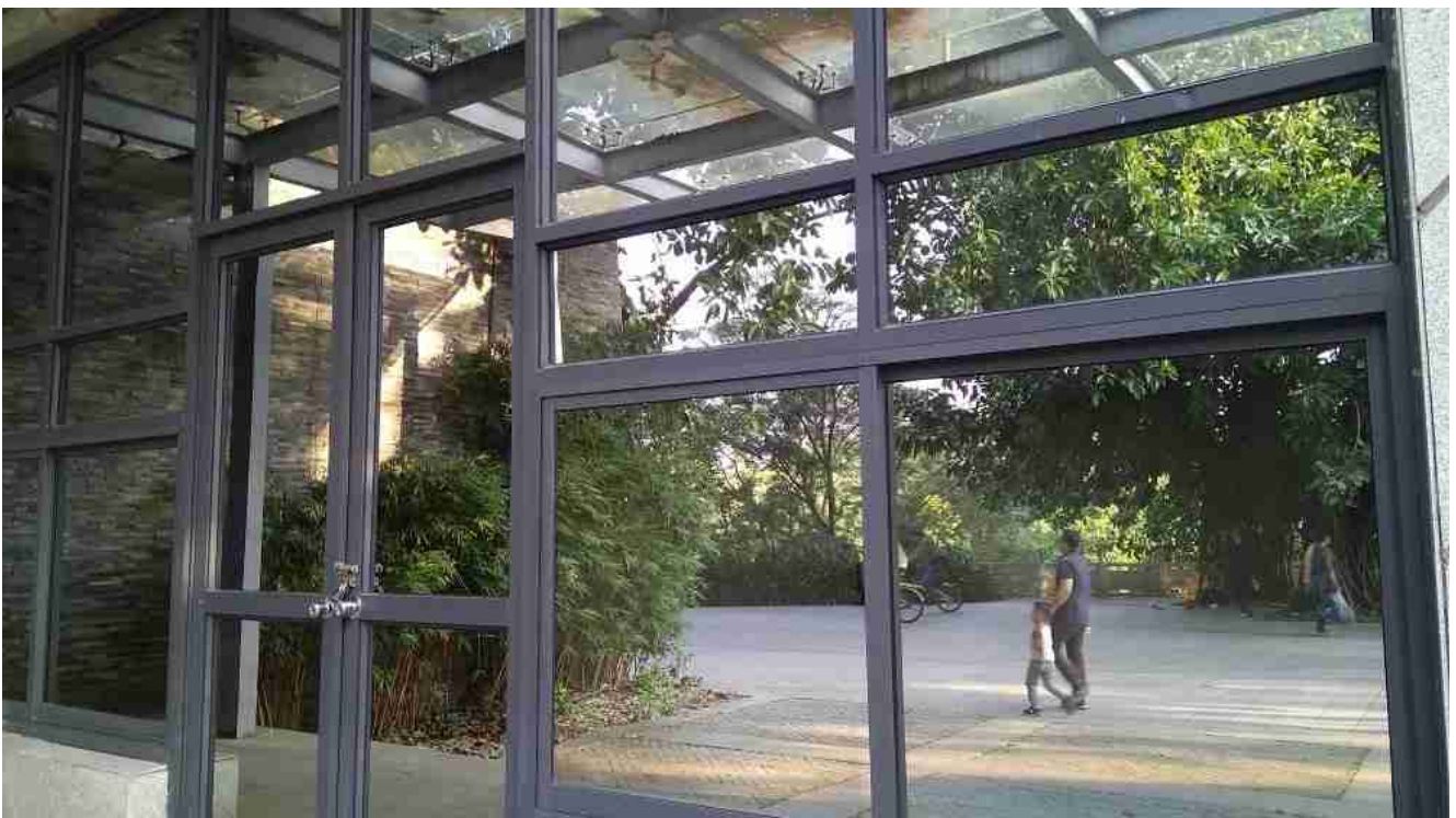
Vidro reflexivo de calor laminado janelas com boa privacidade.