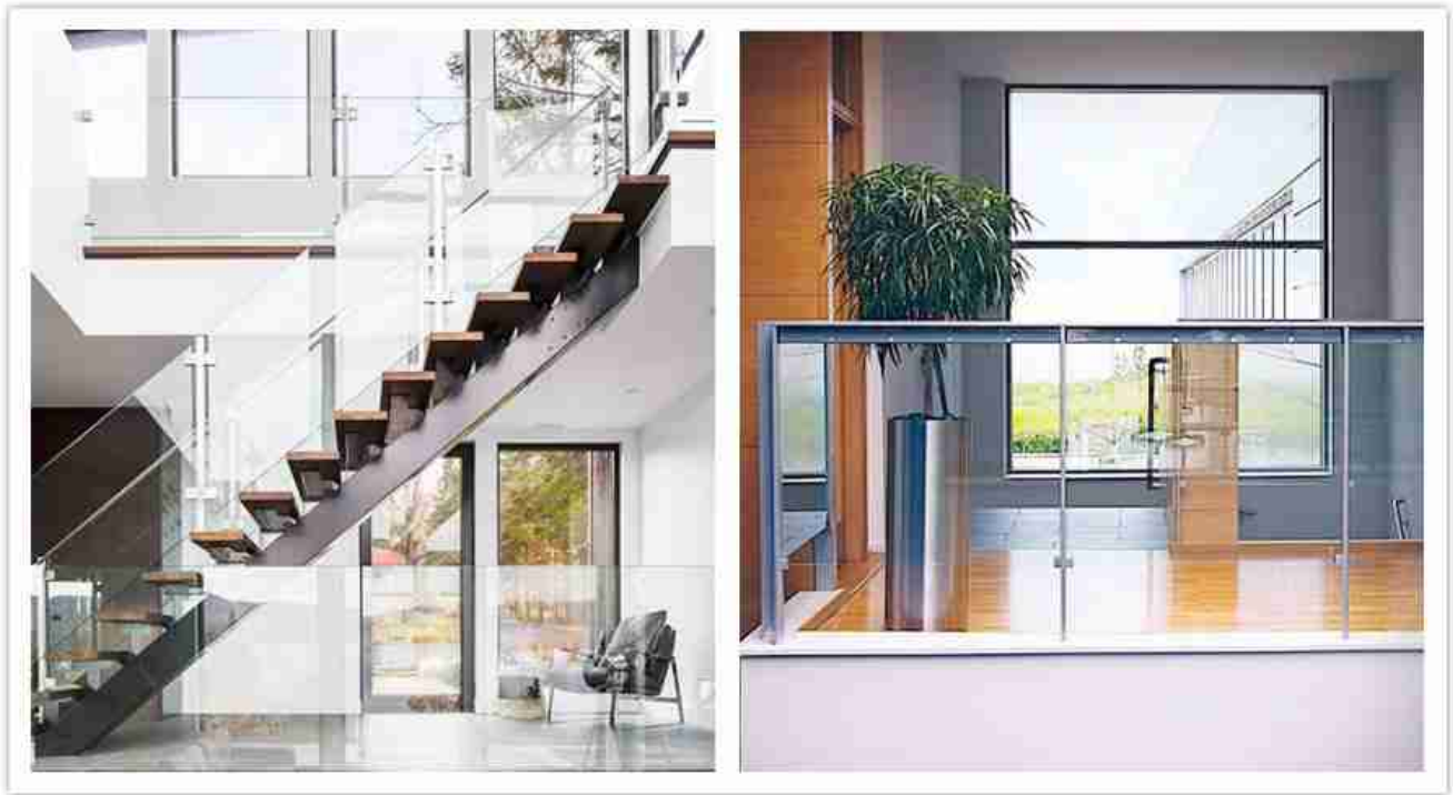
Sistema de grades de vidro