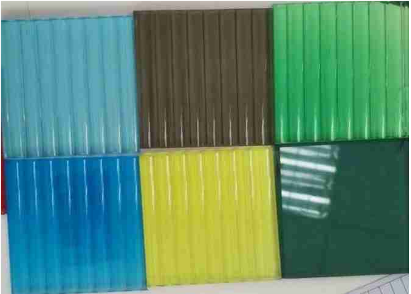
Farget pvb laminert sivglass