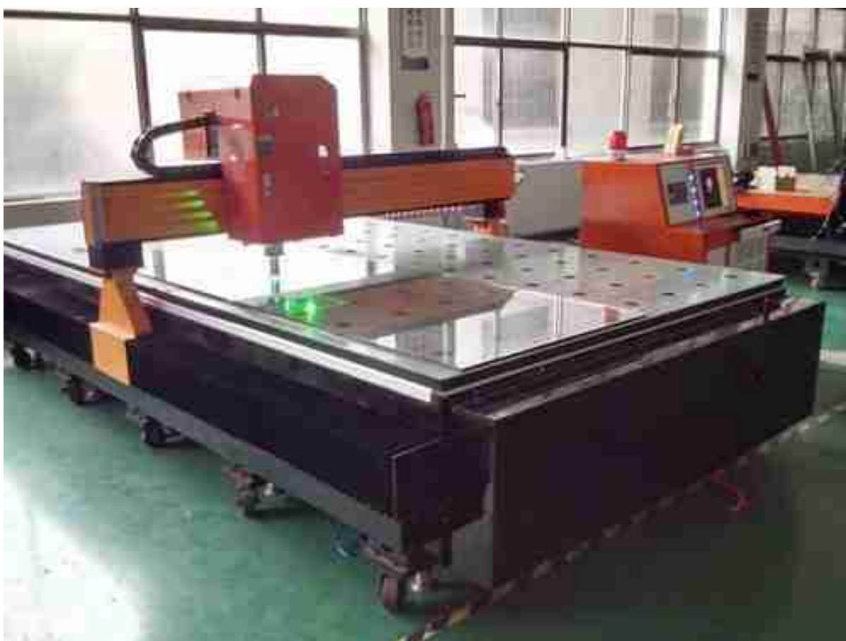
Carving glass maskiner

2, [REDACTED] produsert av glassgraveringsmaskiner. Først designe mønstrene som kundene trenger i CAD tegning og inndata i datamaskinen, senere forvandle mønstrene til CNC graving glassmaskiner. Graveringsmaskinene vil skjære glasset og polere linjene for å danne de nøyaktig utformede mønstrene. På denne måten kan du realisere alle dine riflede glassteksturdesign.