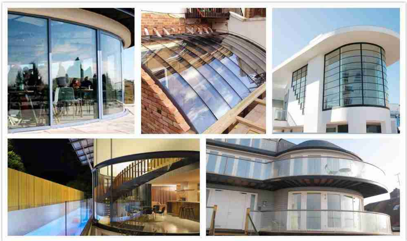
Buede glassvinduer designer