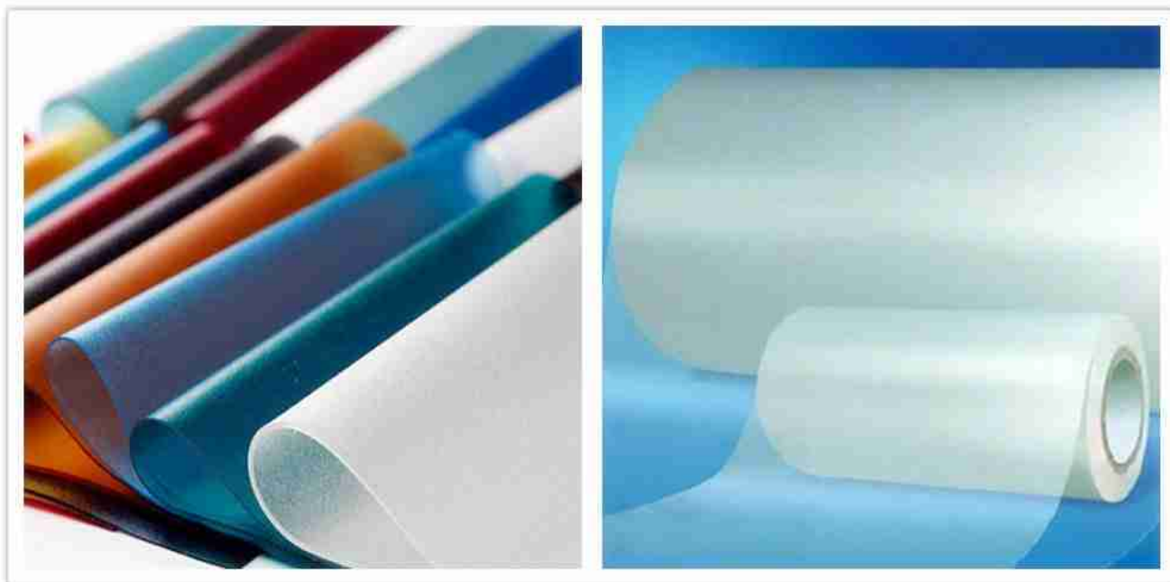
PVB farger og tykkelse

Holes will increase the risk of deformation as well. So 2.28pvb will be safer than 1.52pvb for point fixed glass curtain wall system. Also, 2.28pvb can guarantee there will be no delamination after installation.