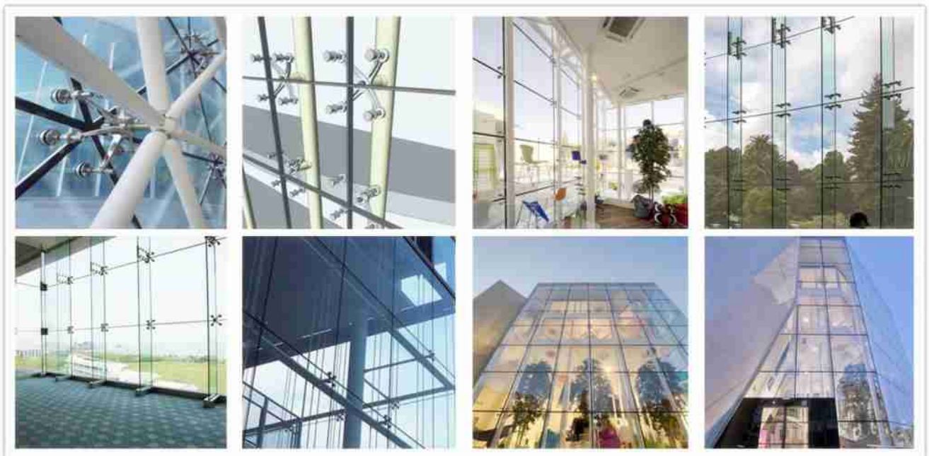
Akustisk laminert glass for gardin vegglass applikasjoner

10 +2.28PVB +10 akustisk laminert glass er super sterk og har god lydisolering funksjon, derfor er det svært populært i programmet for punktet fast glass gardin veggssystem.