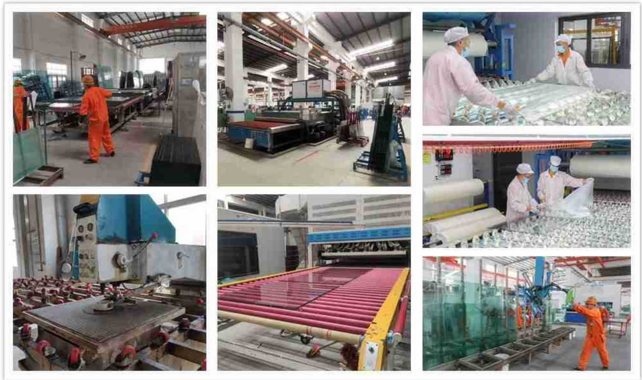
akustisk laminert glass produksjonsdetaljer

Det laminerte gardinveggglasset vil gå gjennom dyp behandling som skjæring, sliping, boring, kantung, herding og laminering, etc.