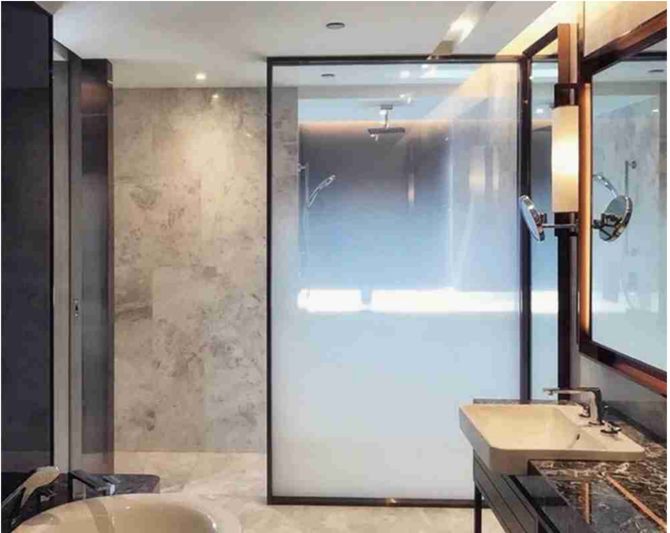
Gradient farge dusj dører herdet glass

If you have any interest in further discussion, welcome to contact us at any time.