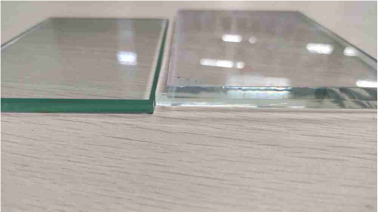
Klart glass vs lavt jernglass