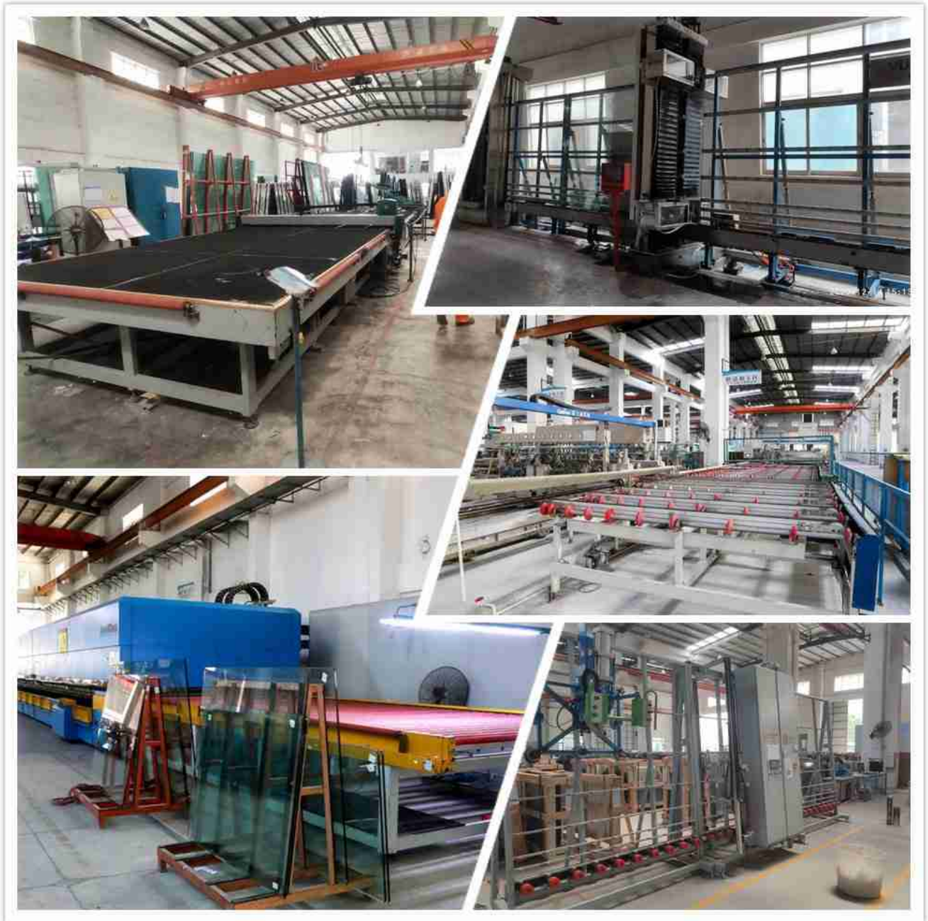
Machines en verre dragon de Shenzhen