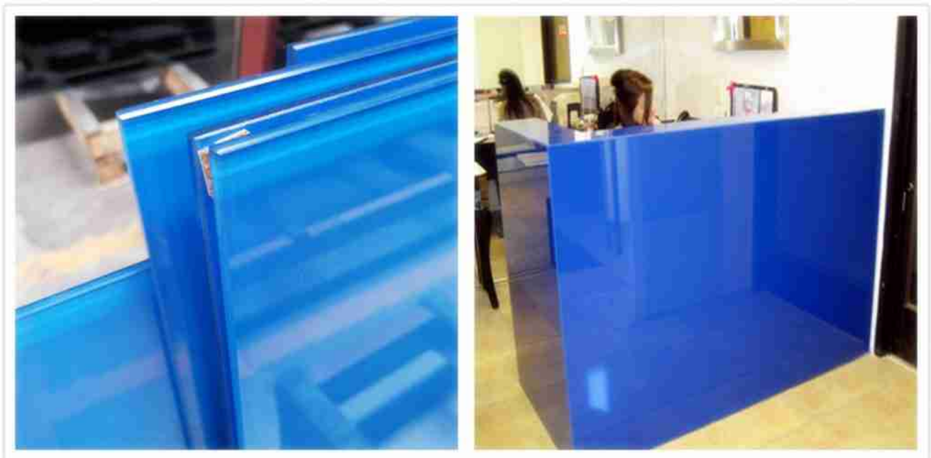
Décor de panneau mural en verre bleu

Couleur bleue 6mm trempé clair + 1.52PVB + 6mm céramique trempée claire frit panneau mural en verre frit utilise un panneau de verre trempé clair de 6mm et l'autre verre frit trempé clair de 6mm avec une couleur bleue pour former une structure «sandwichée» avec une couche intermédiaire de 1.52PVB. Le laminage subit une température et une pression élevées dans un autoclave.