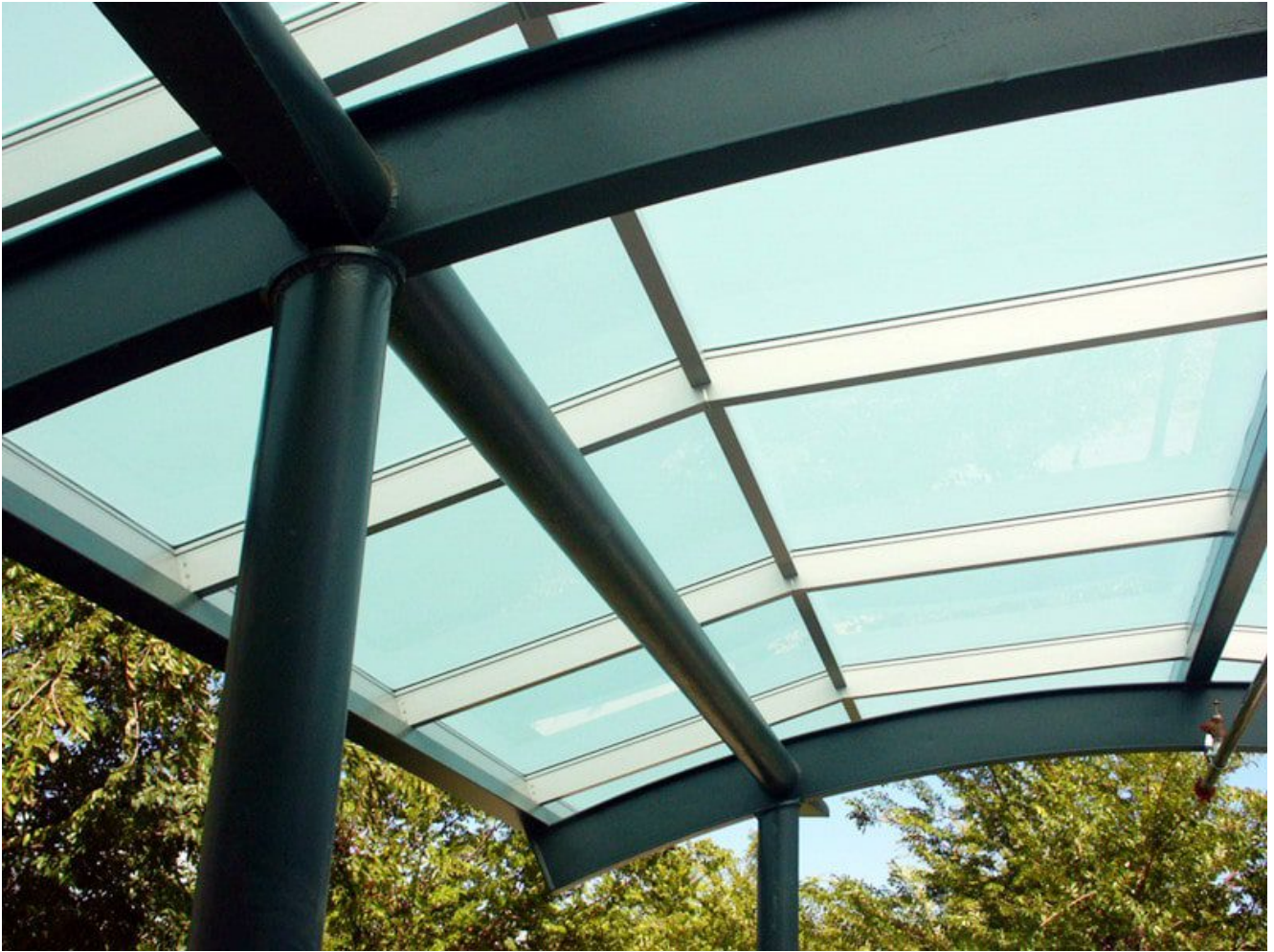
puits de lumière en verre stratifié blanc