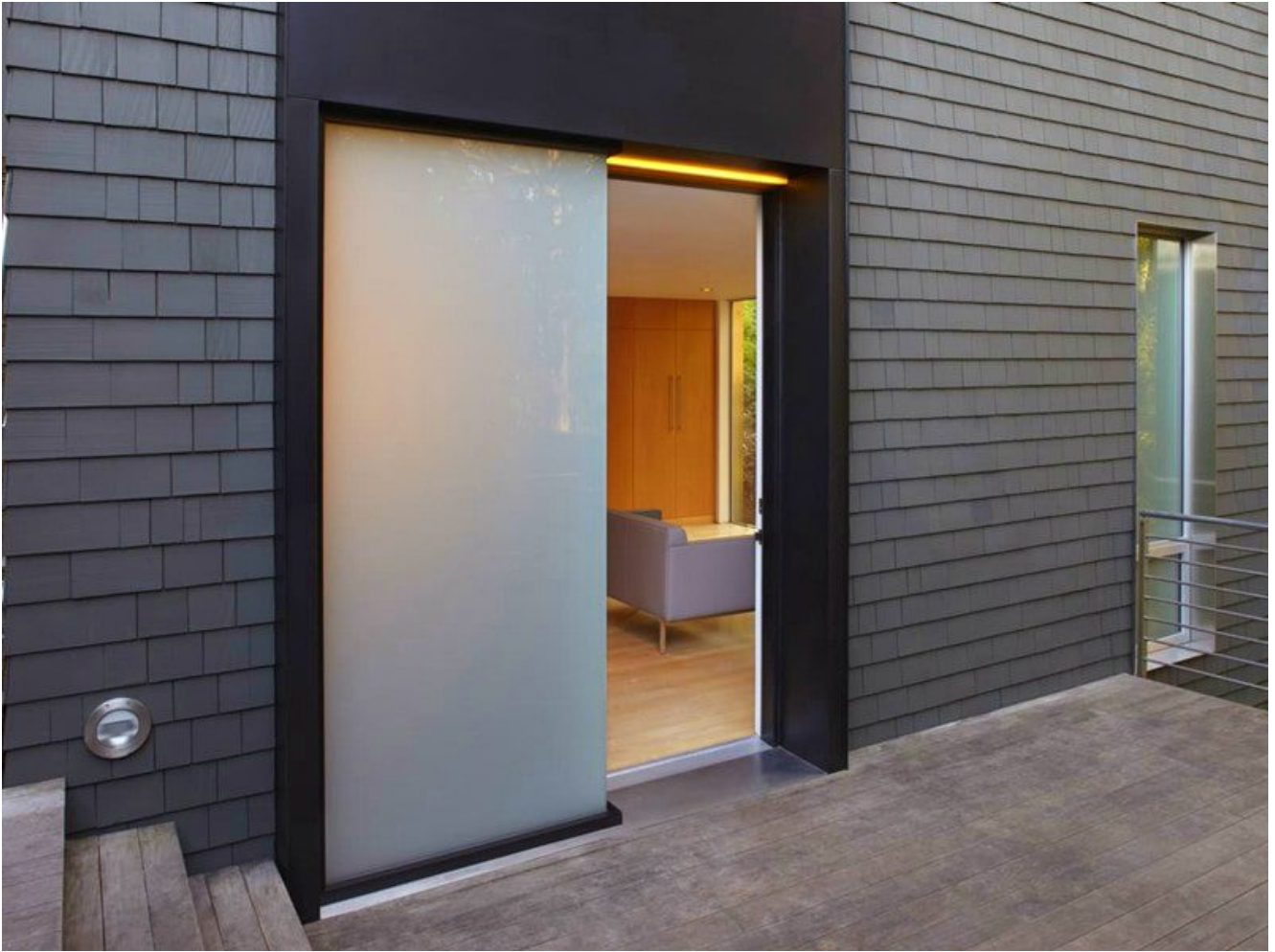
portes intérieures en verre feuilleté blanc