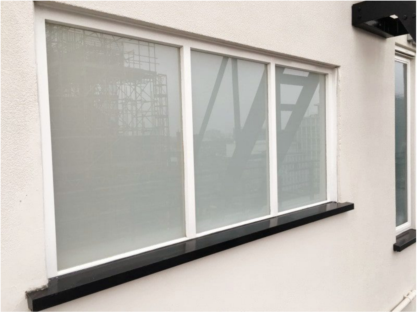
fenêtres en verre feuilleté blanc