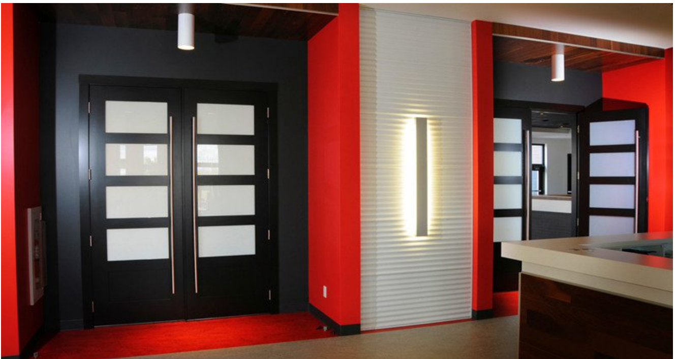
Verre feuilleté de 6,38 mm pour portes Français