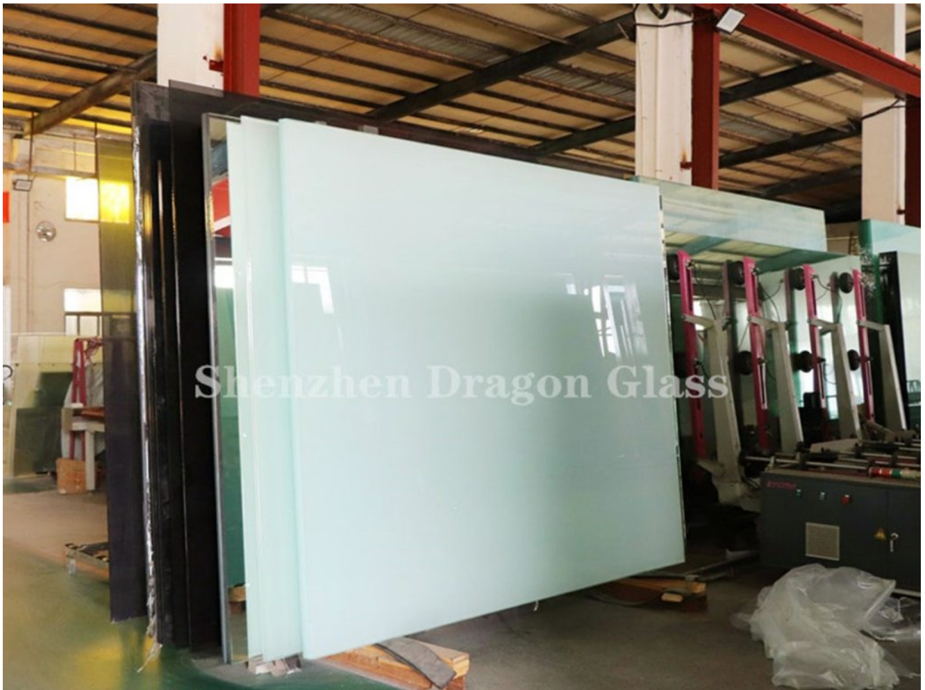
6.38 verre feuilleté recuit blanc