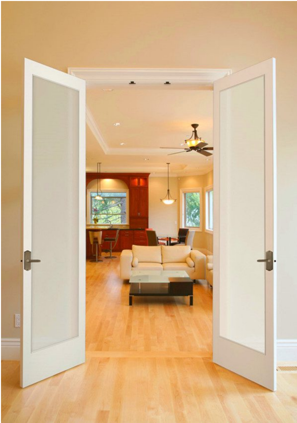
Verre feuilleté de 6,38 mm pour portes Français