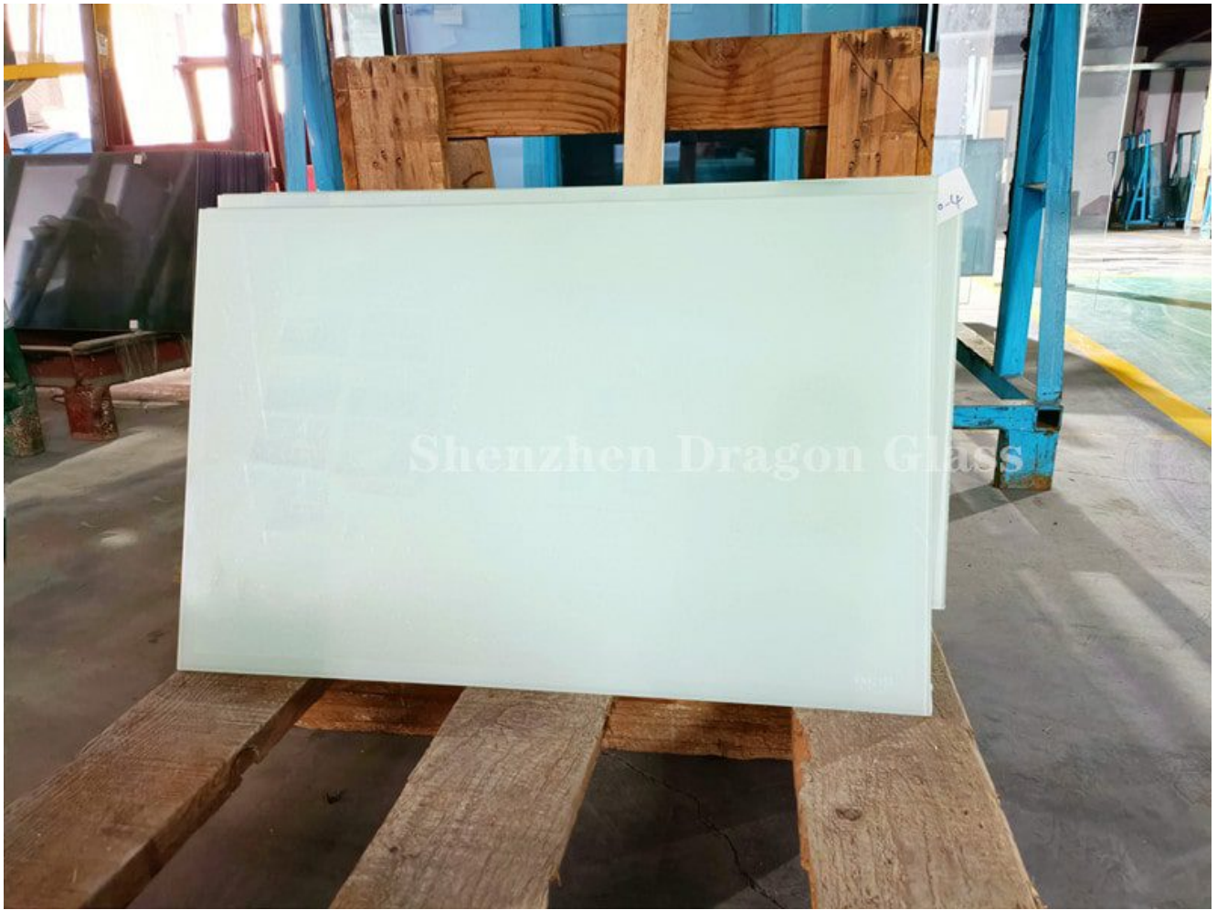
6.38 verre feuilleté recuit blanc