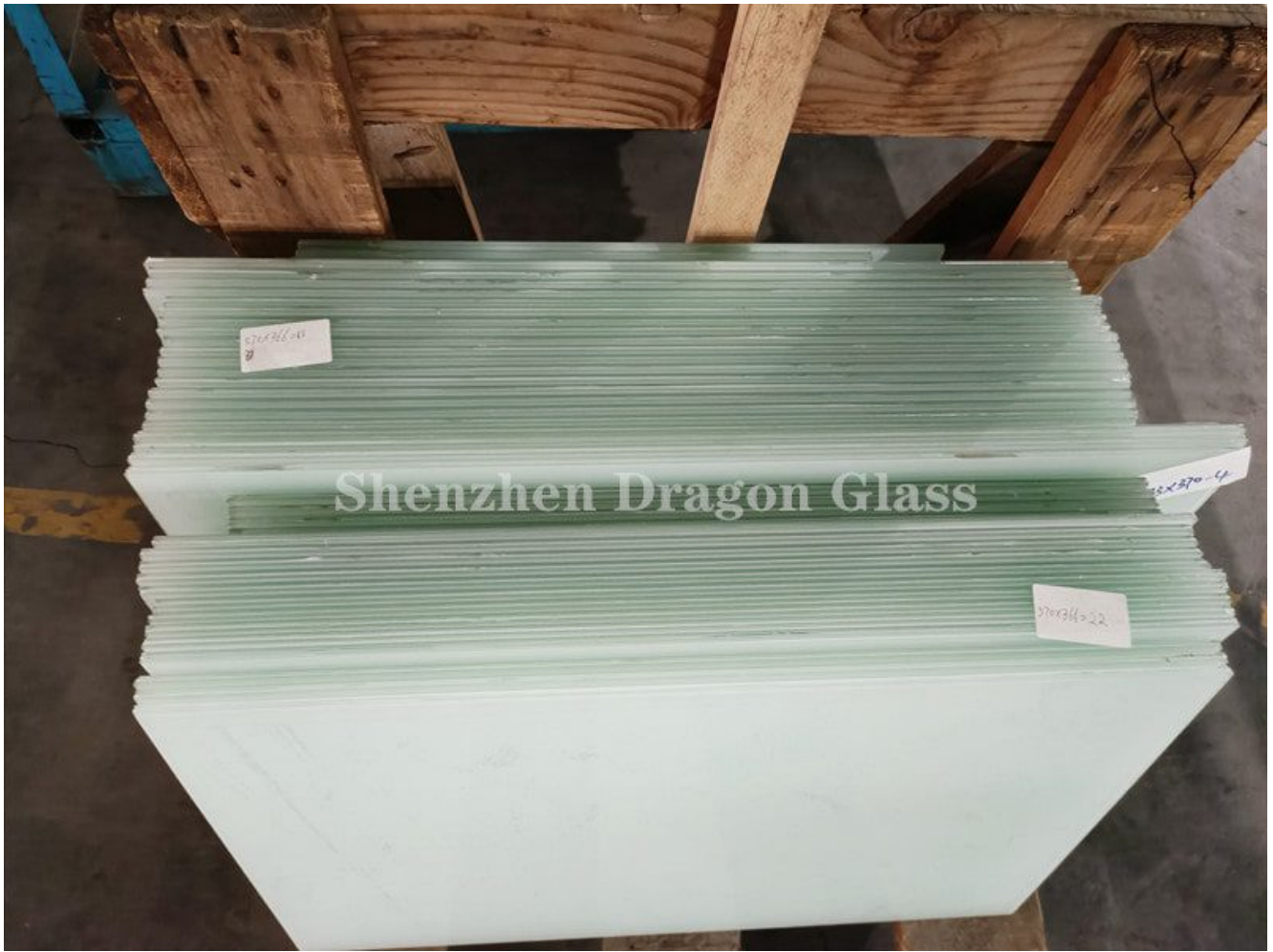
6.38 verre feuilleté recuit blanc