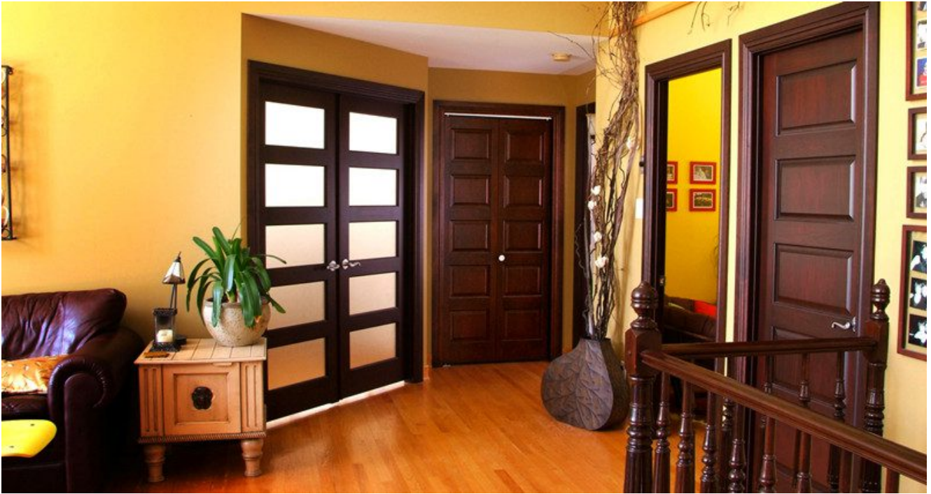
Verre feuilleté de 6,38 mm pour portes Français