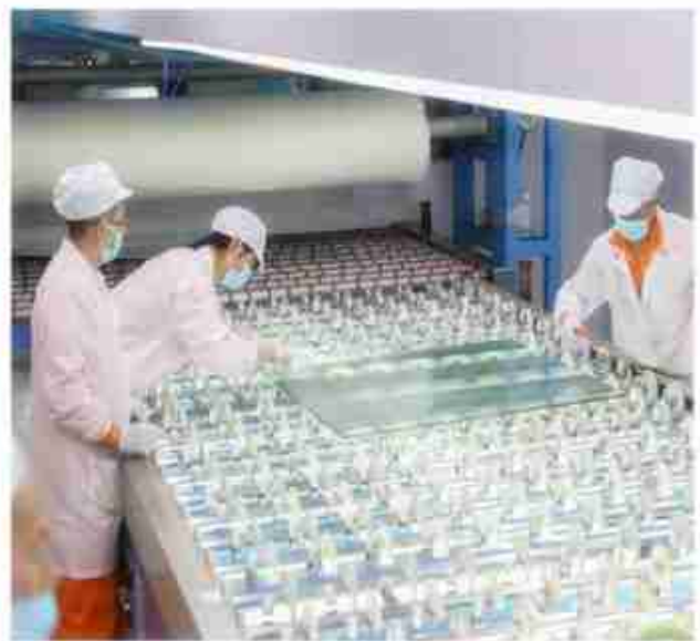
Détails de production pour les produits en verre laminé réfléchissant de 5+5 mm.