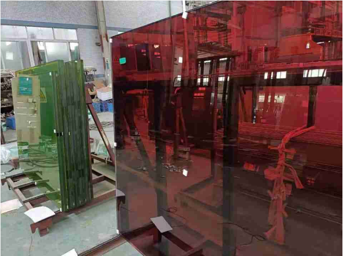
Red laminated glass