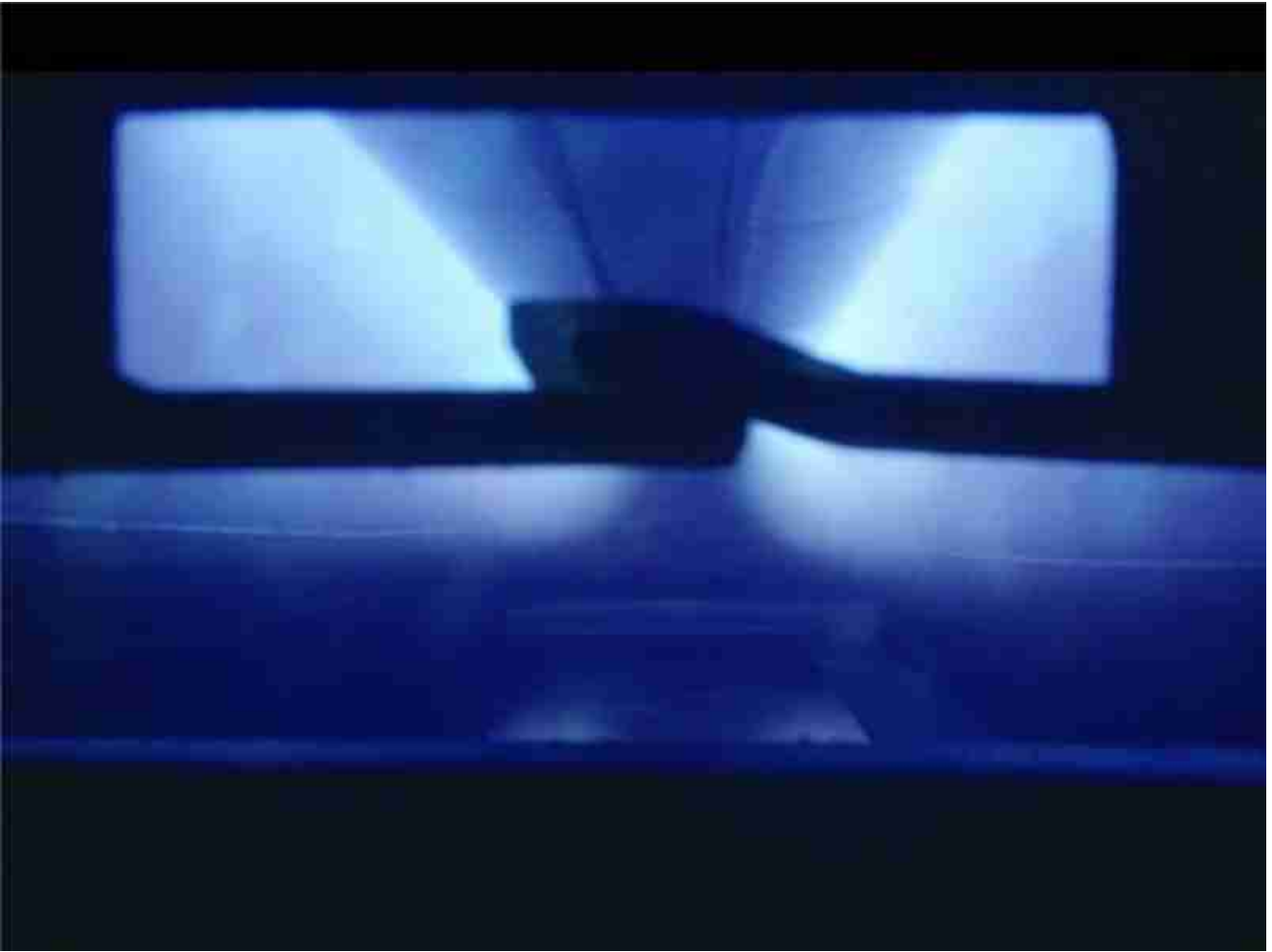
Cr Sputtering -valo