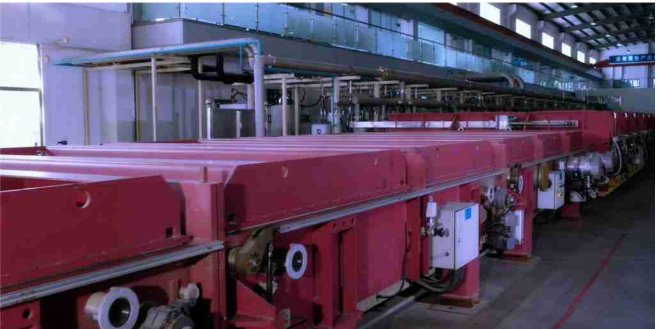
Suuri pinta-ala sputtering linja heijastava lasi tuotanto.