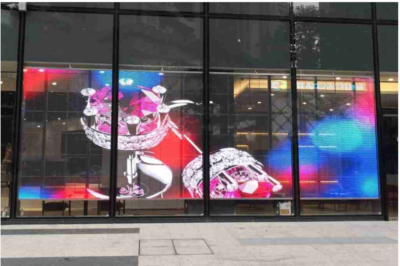
LED-laminoitu lasi julkisivuun