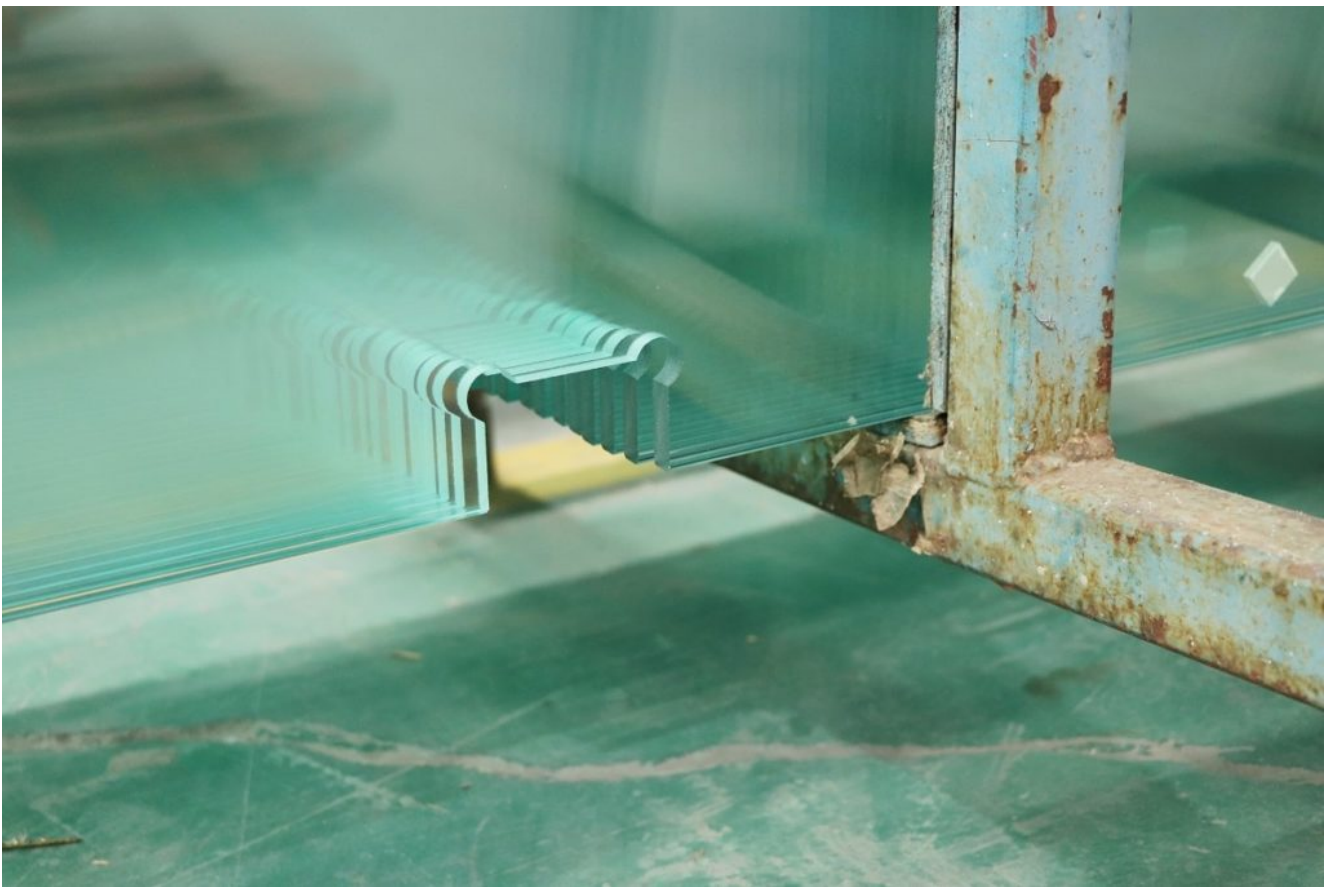
monoliittinen suihkukaapin lasi

Tämän tyyppisen suihkulasin avainkohta olisi karkaistun lasin laadun hallinta, joka on kuvattu yksityiskohtaisesti toisessa artikkelissa. Sillä välin myös karkaistun lasin vääristymiin kannattaa kiinnittää huomiota, sillä se vaikuttaa visuaaliseen esteettiseen tunteeseen. Karkaistun lasin vääristymiä tulee hallita mahdollisimman pienessä mittakaavassa.