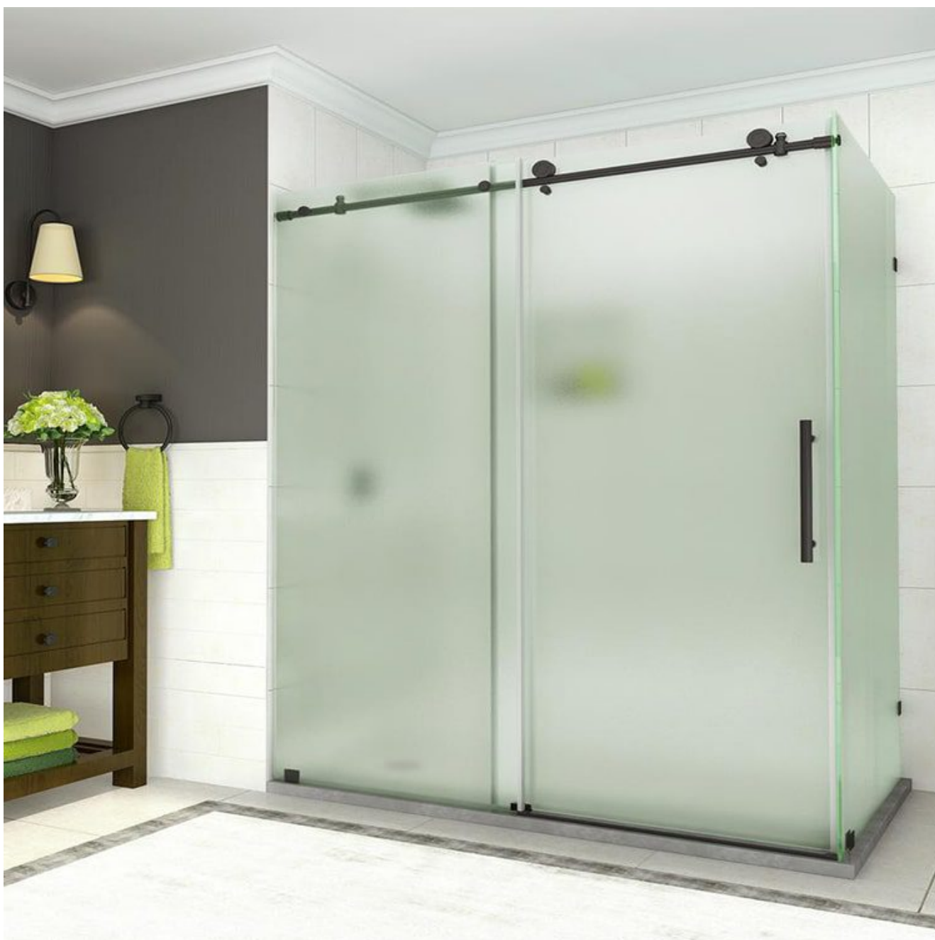
Himmeä läpinäkymätön lasi suihkuseinä

Jos sinulla on hyvä budjettikorvaus, happoetsattu lasi on epäilemättä parempi epäselvien satiinimallien kanssa!