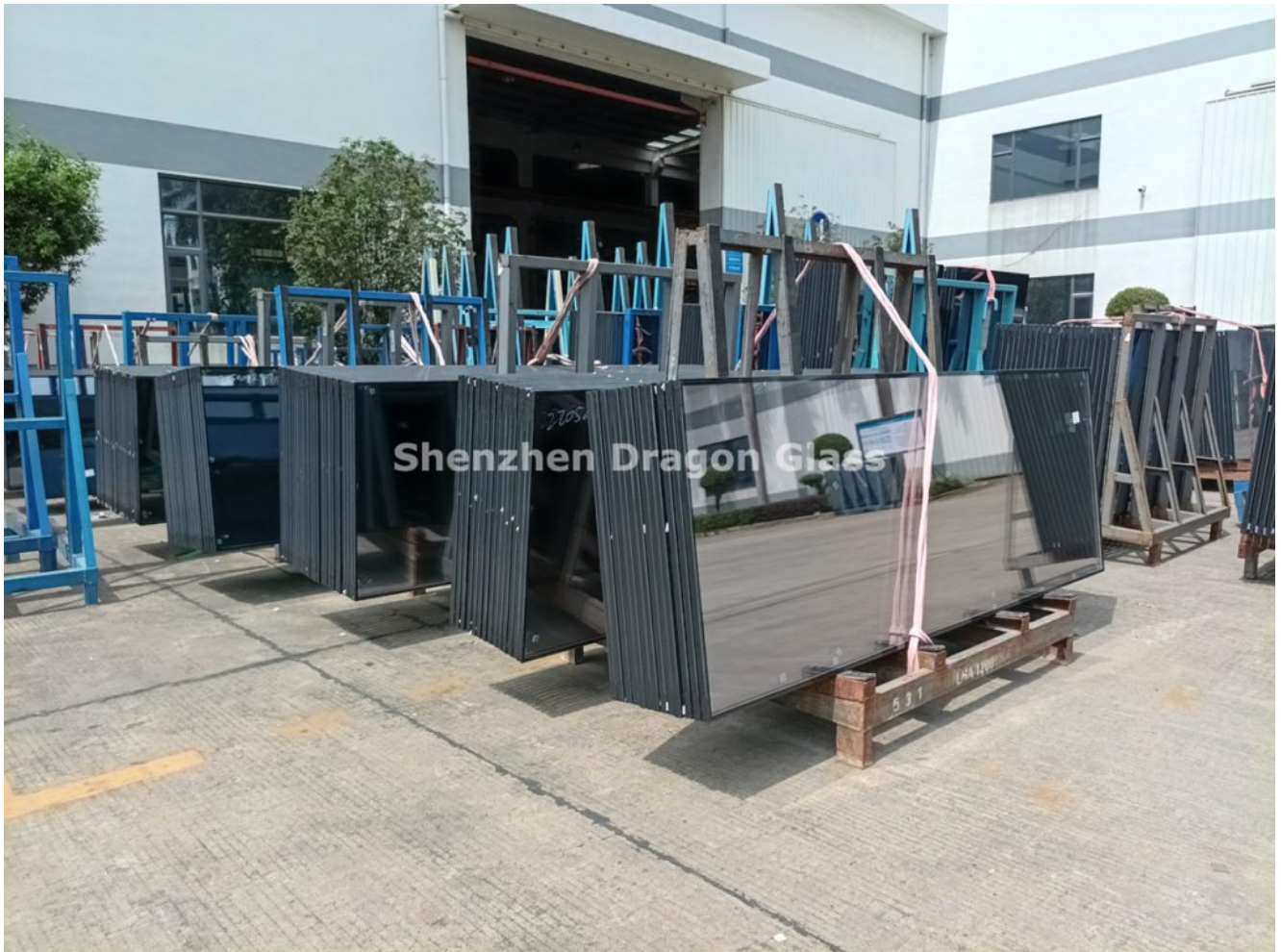
6mm matala-E karkaistu+9A+6mm kirkas karkaistu eristetty lasitus