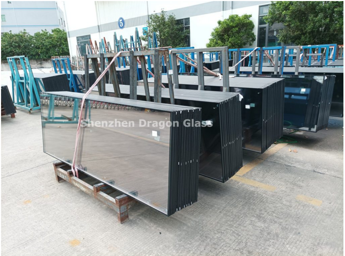
6 mm matala-E karkaistu+ 9 A+6 mm kirkas karkaistu eristetty lasi