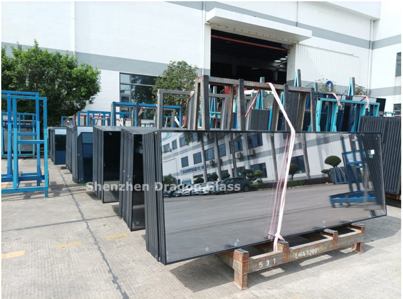
6 mm matala-E karkaistu+ 9 A+6 mm kirkas karkaistu eristetty lasi