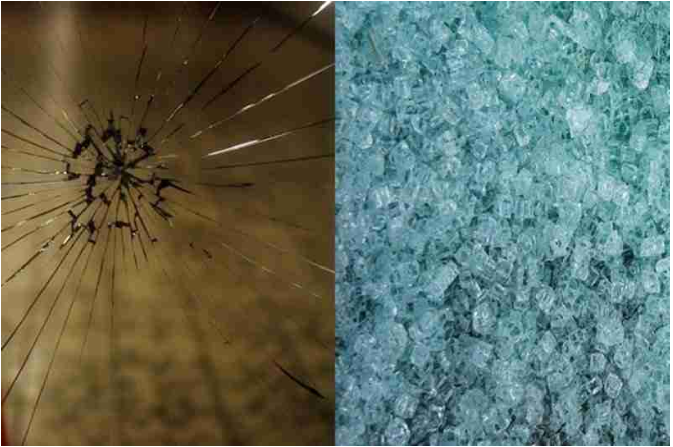
rotura de vidrio templado vs rotura de vidrio flotador