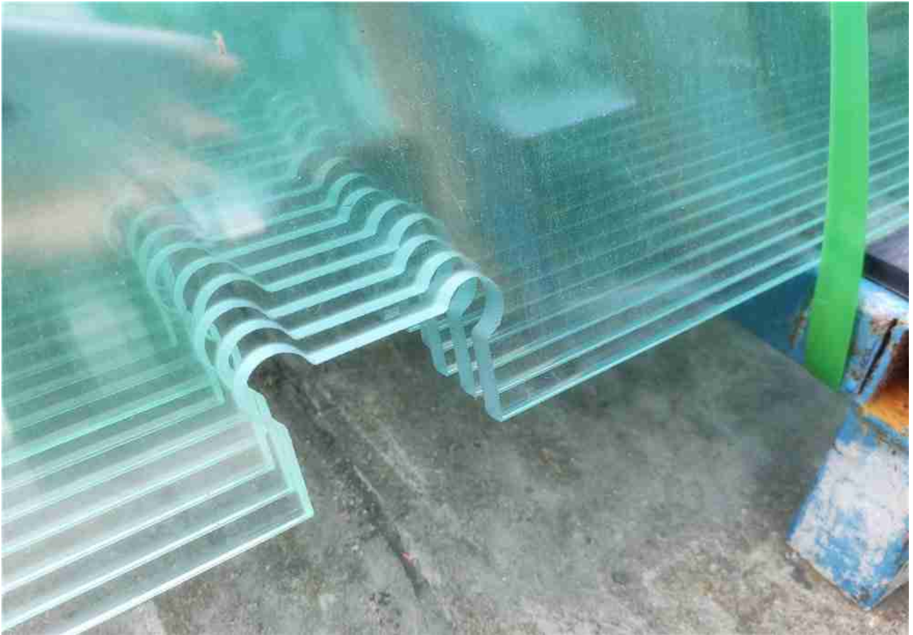
vidrio flotante templado procesado con precisión