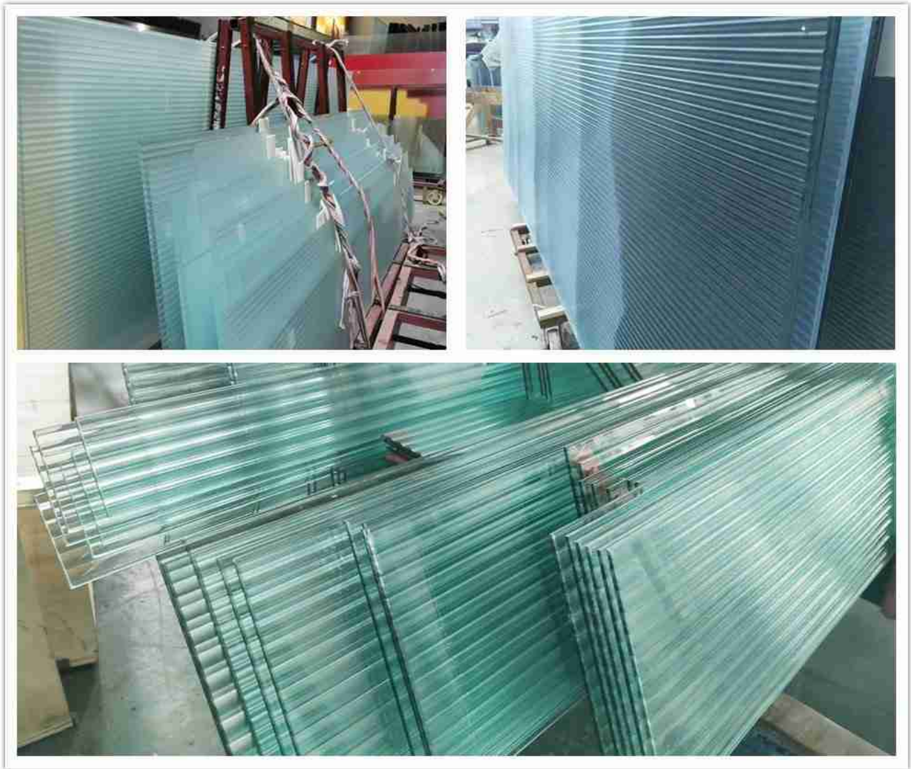
detalle del producto de la puerta de vidrio