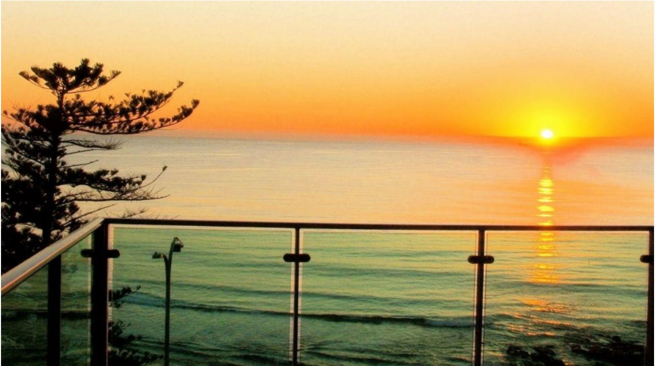
barandilla exterior de vidrio