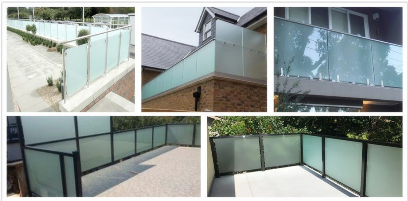
Vidrio laminado satinado para barandilla.