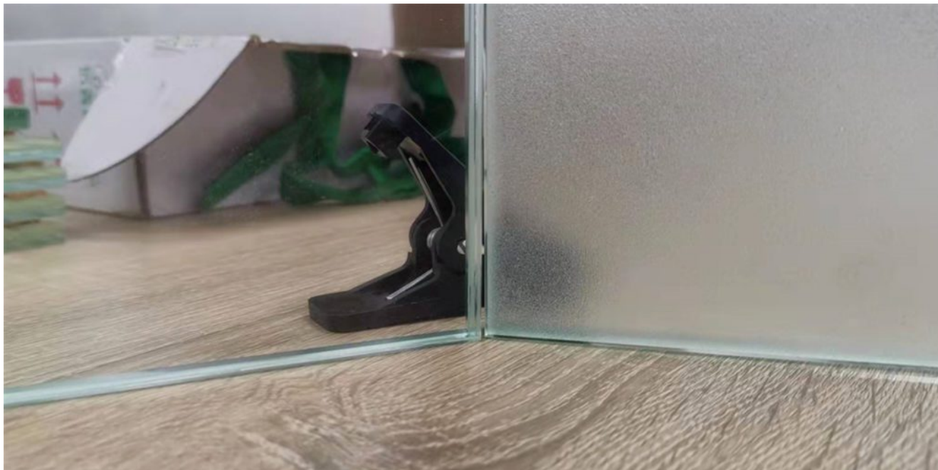
8.8.4 Vidrio laminado mate transparente SGP

arenado es más eficiente en producción y economía. Normalmente, el lado esmerilado está en la cara 4#. Como se muestra en el dibujo.