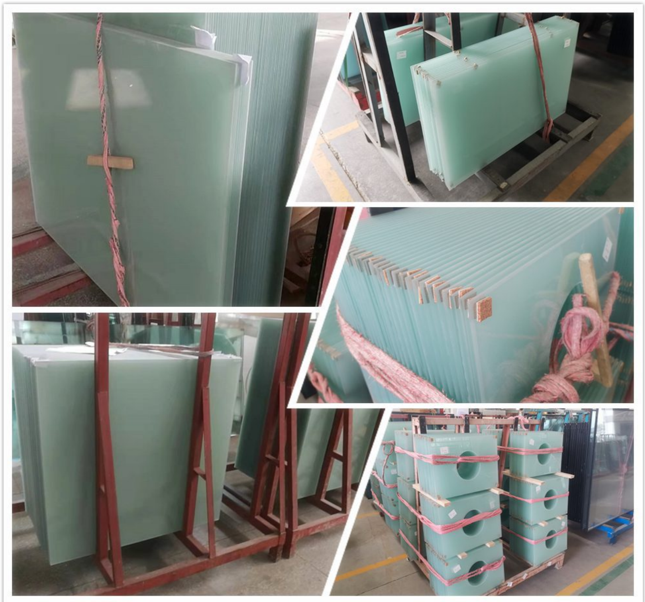
Detalles de producción de vidrio esmerilado.