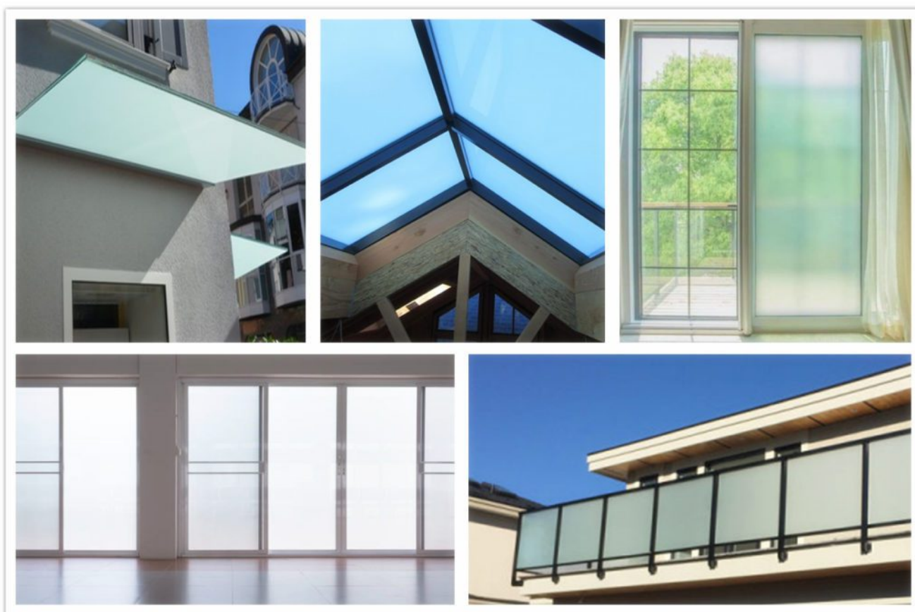
Aplicaciones de vidrio laminado esmerilado

El vidrio laminado esmerilado transparente 17.52SGP también se puede usar para techos, marquesinas, pasillos, fachadas, ventanas, puertas, etc. Como se muestra en las imágenes: