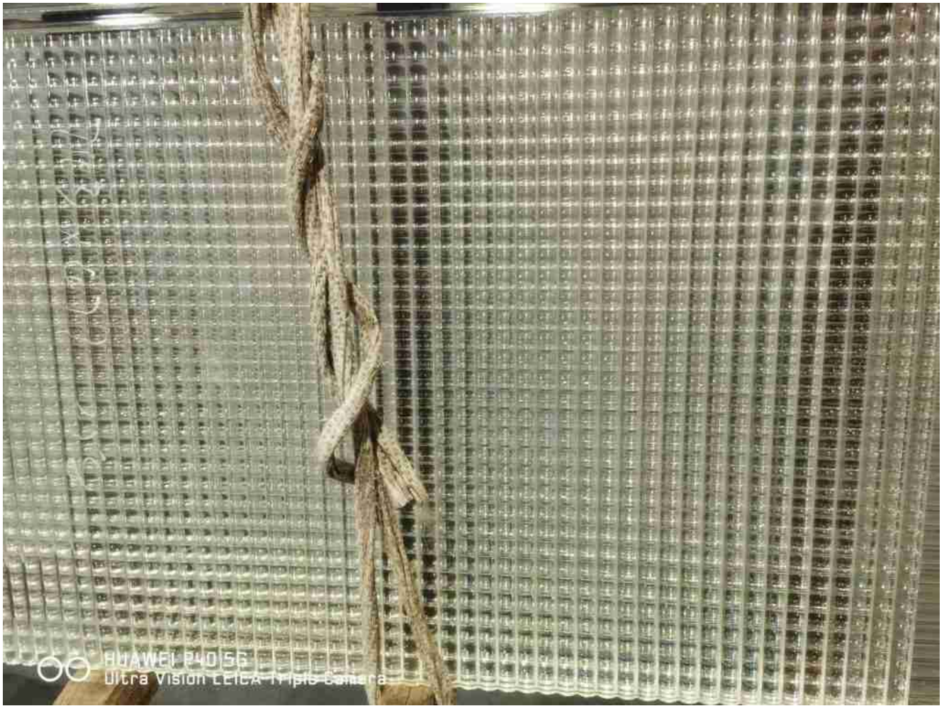
Patrones de vidrio de caña cruzada diseños únicos