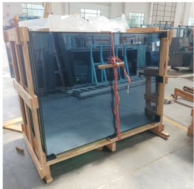
Dragon Glass hermético doble acristalamiento

Ejemplos de video compartir para usted, si cree que este color azul no puede coincidir con sus proyectos, le sugerimos que considere enviarnos sus piezas de muestra o detalles, entonces nuestro equipo puede hacer coincidir lo que necesita.