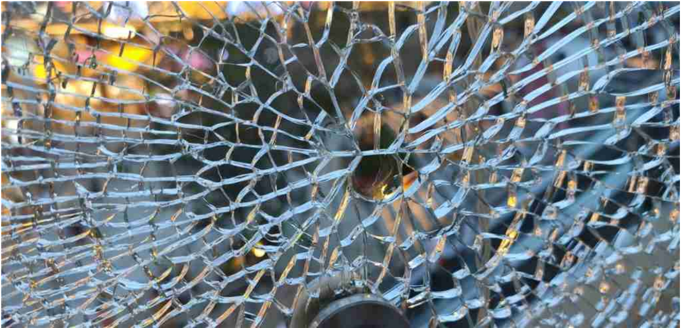
Rotura de vidrio templado de 12 mm

Sin embargo, todos los vidrios templados tienen un riesgo potencial de [REDACTED], para reducir la rotura espontánea, se sugerirá el vidrio de prueba de inmersión en calor .