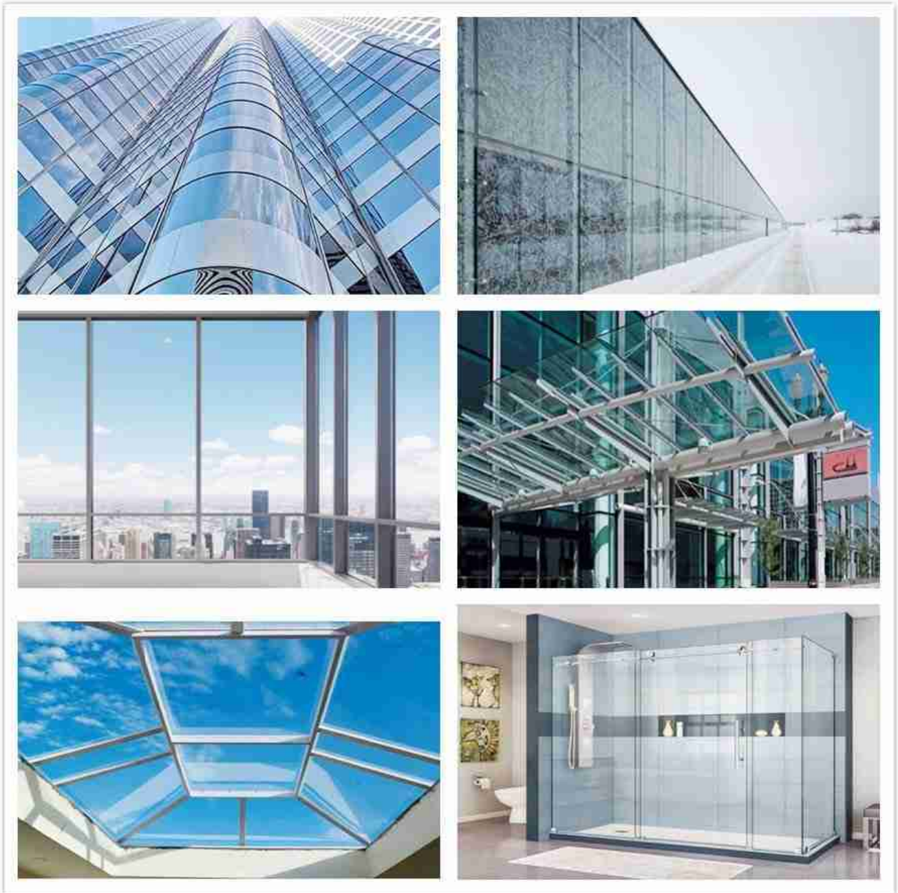
Aplicaciones de vidrio templado.