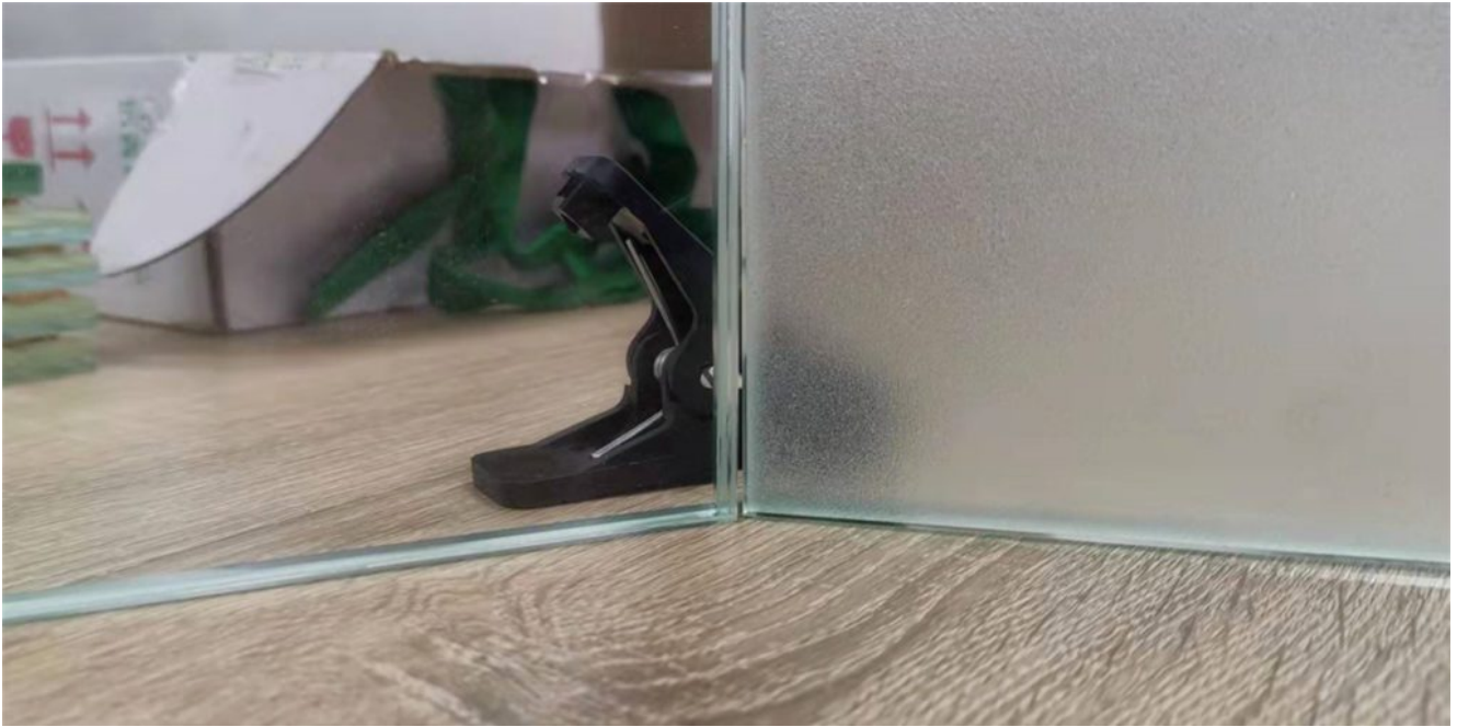
8.8.4 SGP klares mattiertes Verbundglas