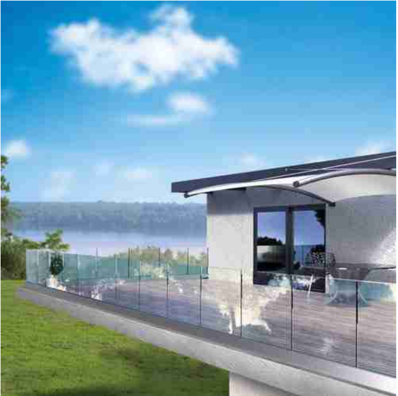
Glasgeländersystem für Decks