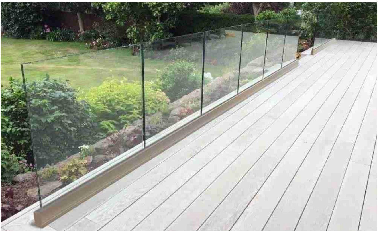
U-Kanal gehärtetes Glas Verbundglas für Decking Preis