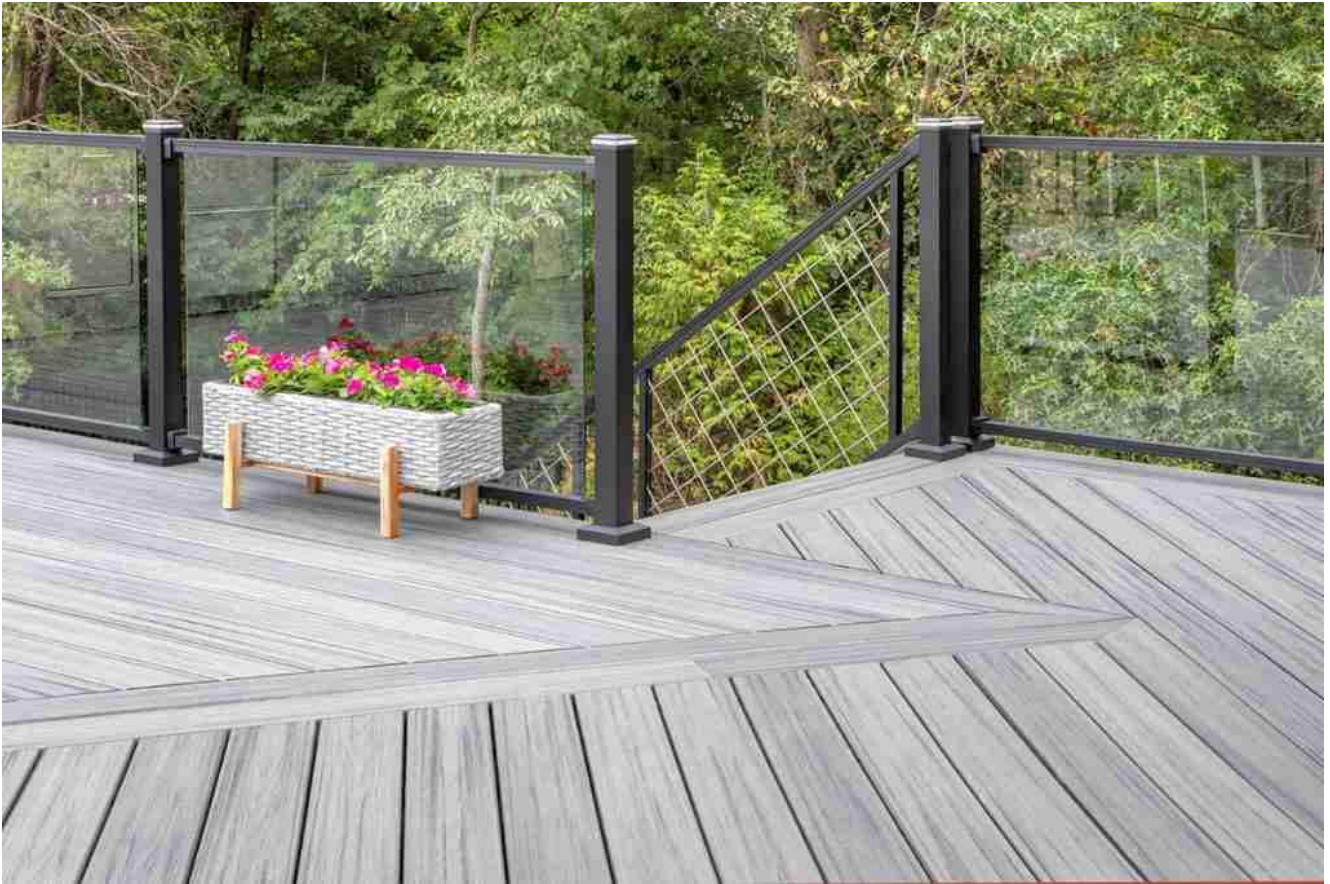
Rahmen gehärtetes Glas Verbundglas für Decking Preis