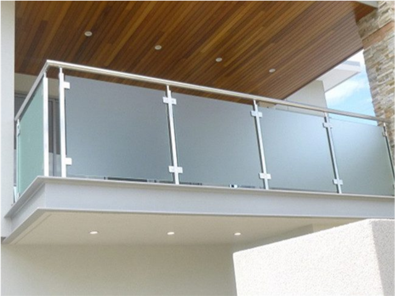
Milchglas für Balkongeländer