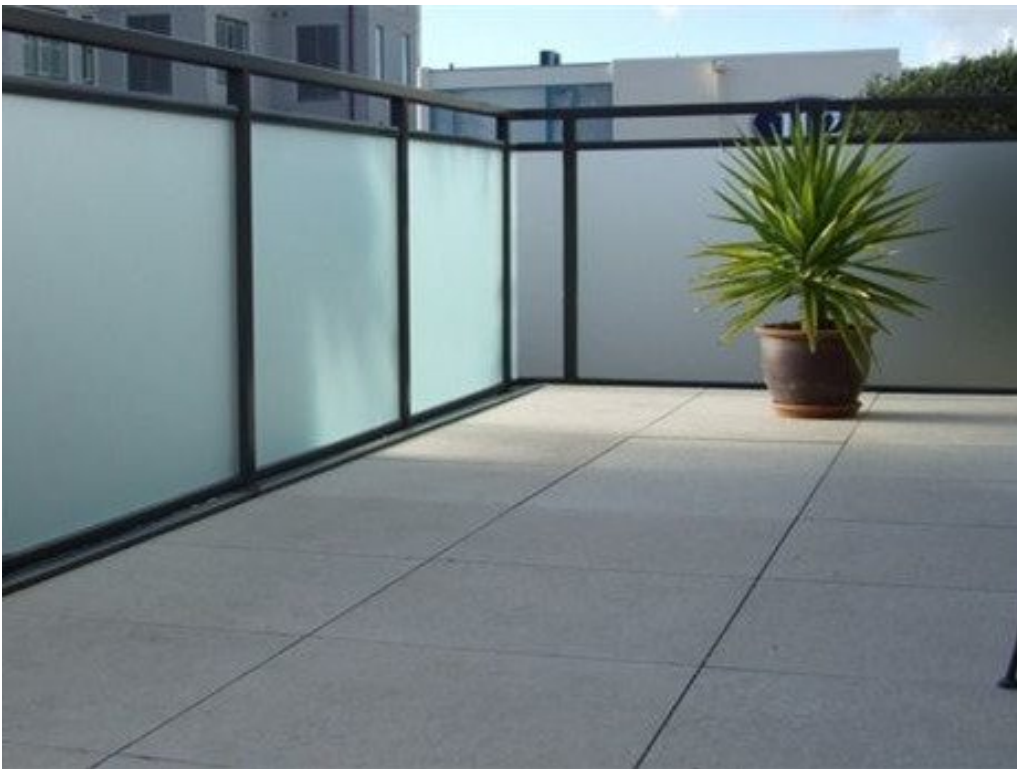
Milchglas für Balkongeländer