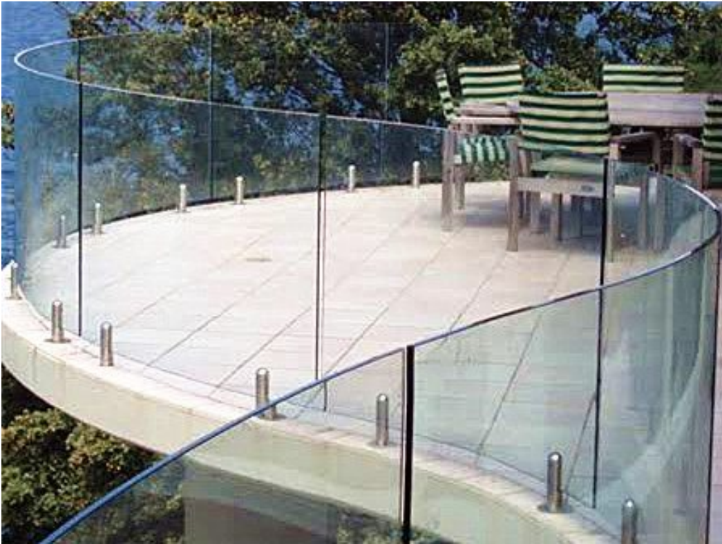
Gebogenes Glas für Balkongeländer