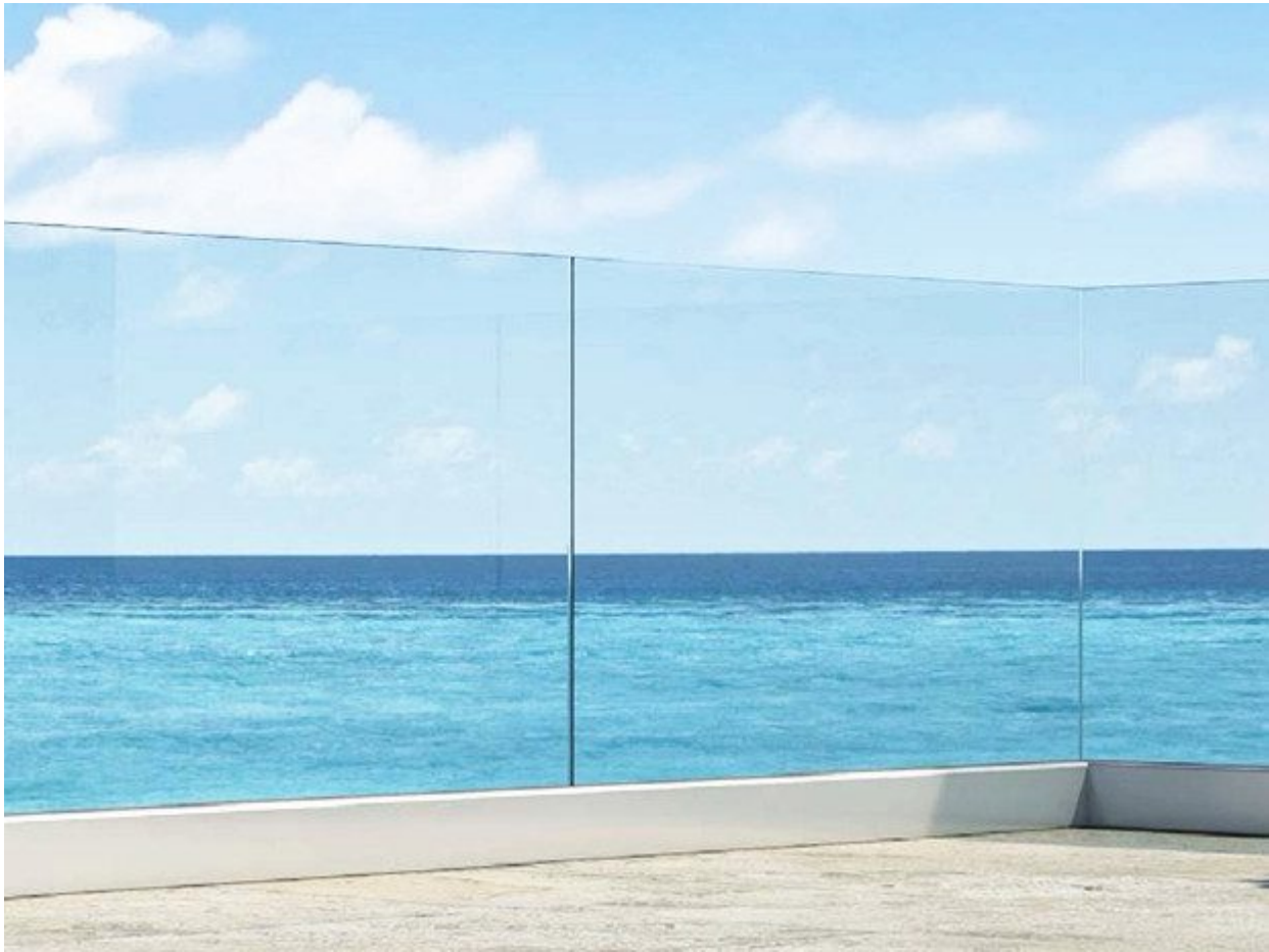
Rahmenloses modernes Balkongeländer

vergessen lassen und nur eine schöne Landschaft in Ihren Augen haben.