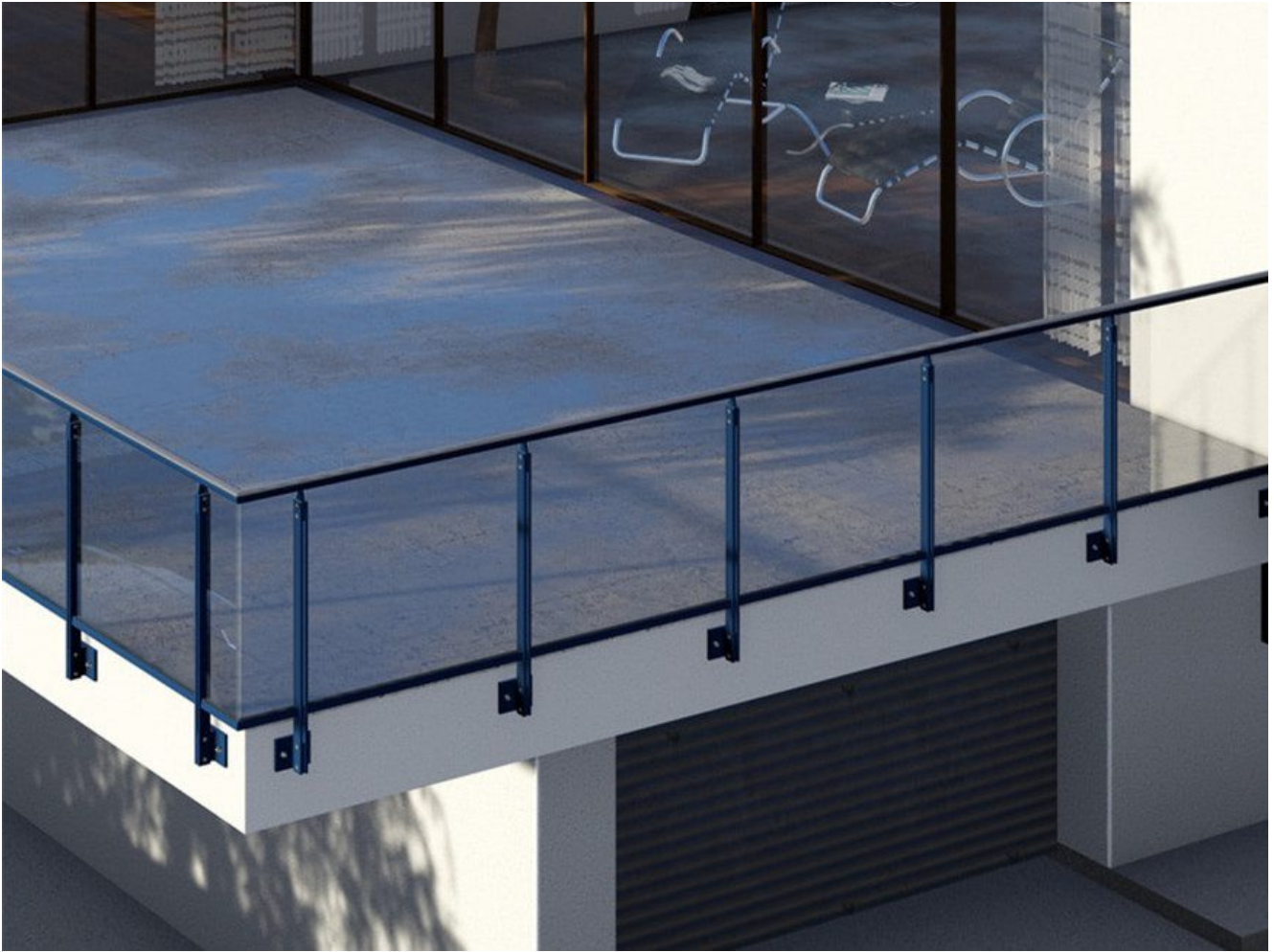
Minimales schwarzes Rahmenbalkongeländer

Milchglas-Balkondesigns verleihen Ihrem Balkon nicht nur Design und Interesse, sondern schützen auch Ihre Privatsphäre. Wenn Sie Ihre Privatsphäre schützen möchten, ist dies eine gute Wahl.