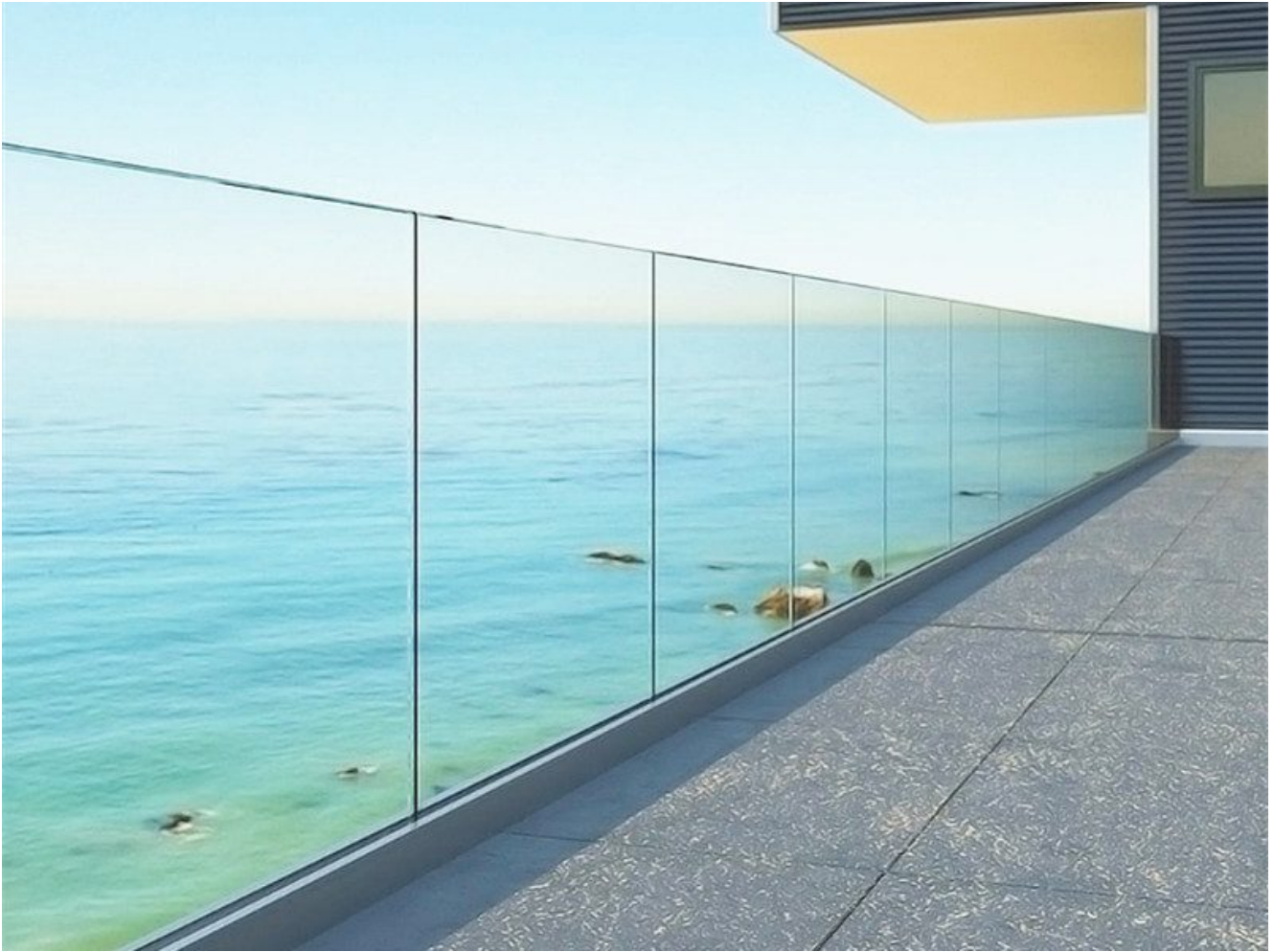
Rahmenloses modernes Balkongeländer

Neben rahmenlosen Glasgeländern haben wir auch moderne Glasgeländer für Balkone mit Edelstahlhalterungen, Sie können verschiedene Edelstahlstile wählen, um Ihre eigenen modernen Glasgeländer zu erstellen, dieses Design ist eher für die Heimdekoration geeignet.