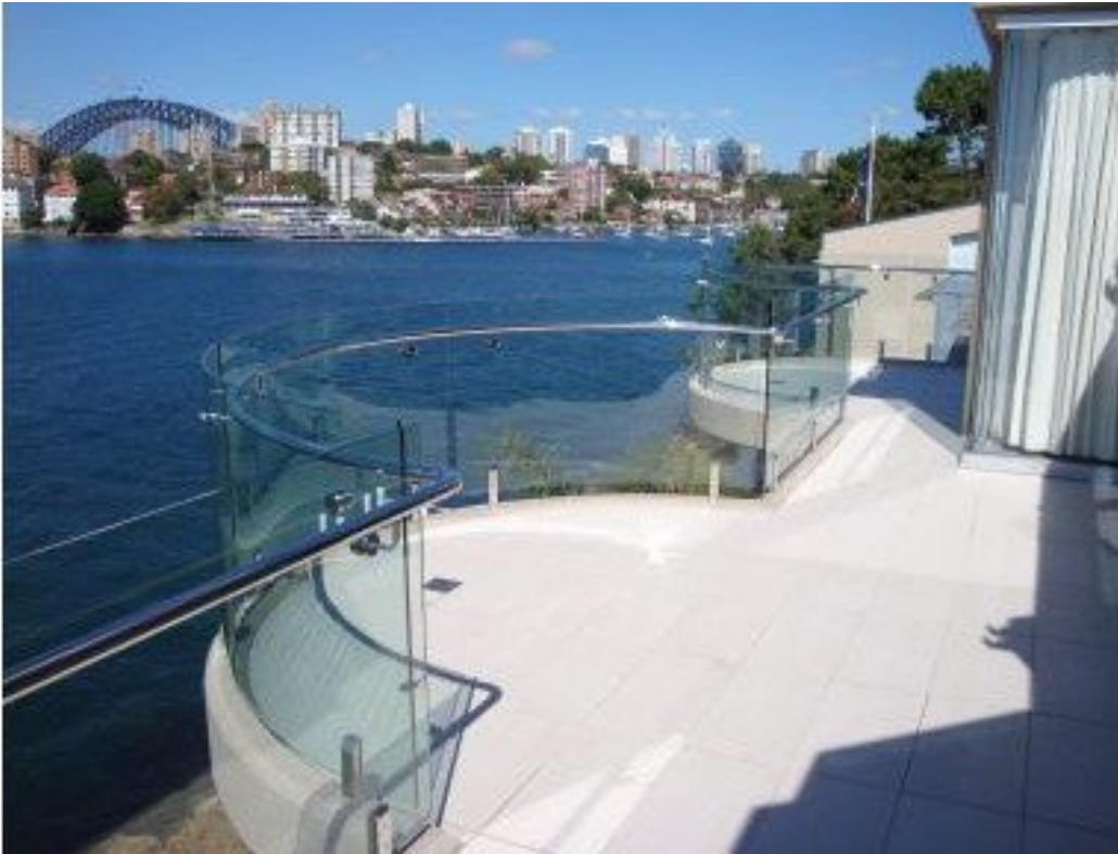
Gebogenes Glas für Balkongeländer

Das geschwungene Balkongeländer ist ebenfalls ein unregelmäßiges Design. Dieses Design kann den Platz Ihres Balkons optisch vergrößern und Ihnen das Gefühl geben, dass der Balkon breiter ist.