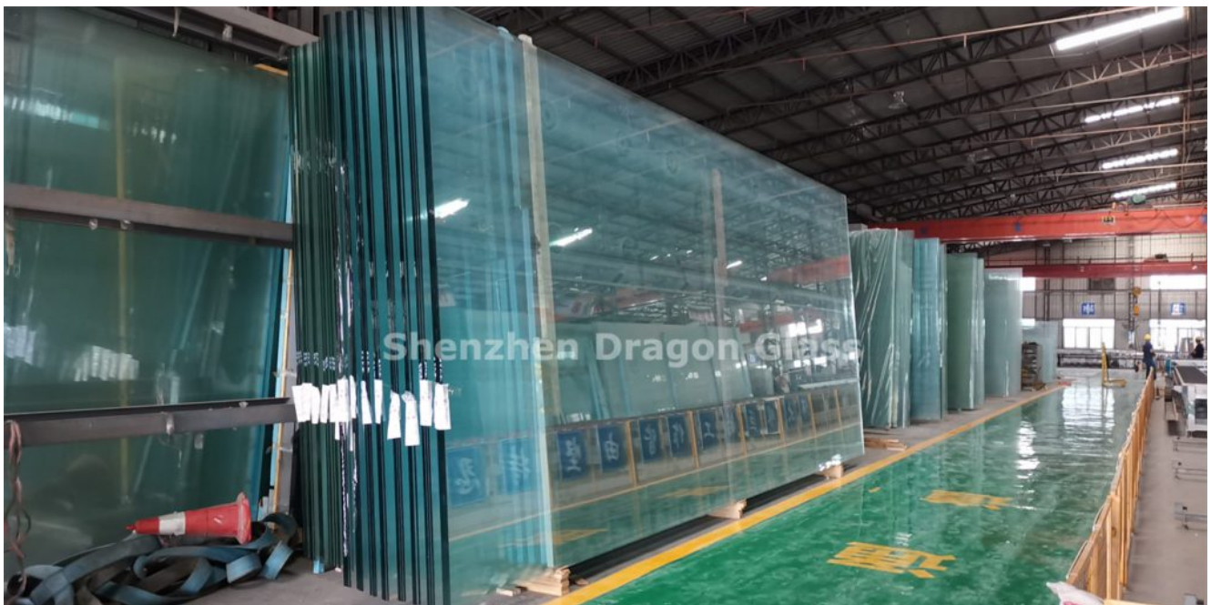
Übergroßes Glas in unserem Lager

Standard-Glasgröße ist 96 „x 130“, Full-Size-Glas ist 100 „x 144“. Jumbo-Glas hat normalerweise eine Breite von 130 „und eine Höhe von 204“, was riesige und fortschrittliche Produktionsanlagen erfordert. Die maximale Länge, die Shenzhen Dragon Glass herstellen kann, beträgt 12000 mm, die maximale Breite von 3300 mm. Übergroßes Glas ist größer, schwerer und dicker als Standardglas und muss während des Transports, der Lagerung und der Installation mit Vorsicht gehandhabt werden. Das macht den Preis für Jumbo-Glas viel höher als bei herkömmlichen Glasgrößen.