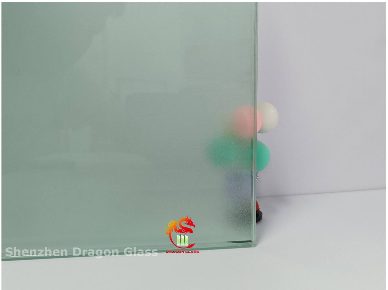
Sandgestrahltes Glas, Effekt „Unschärfe“