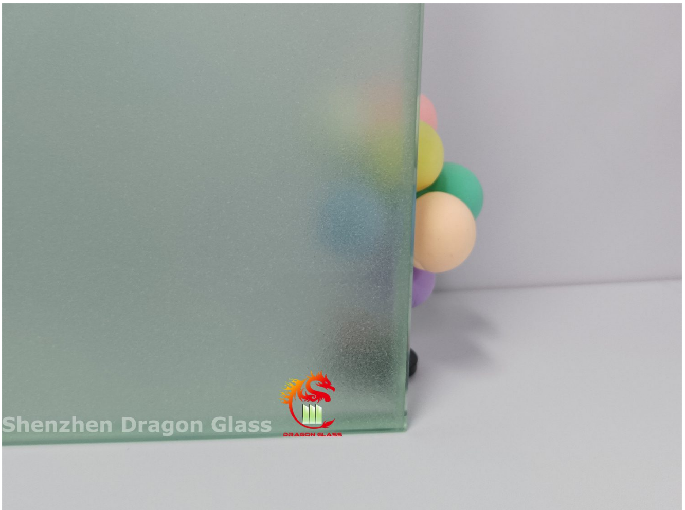
Sandgestrahltes Glas, Effekt „Unschärfe“