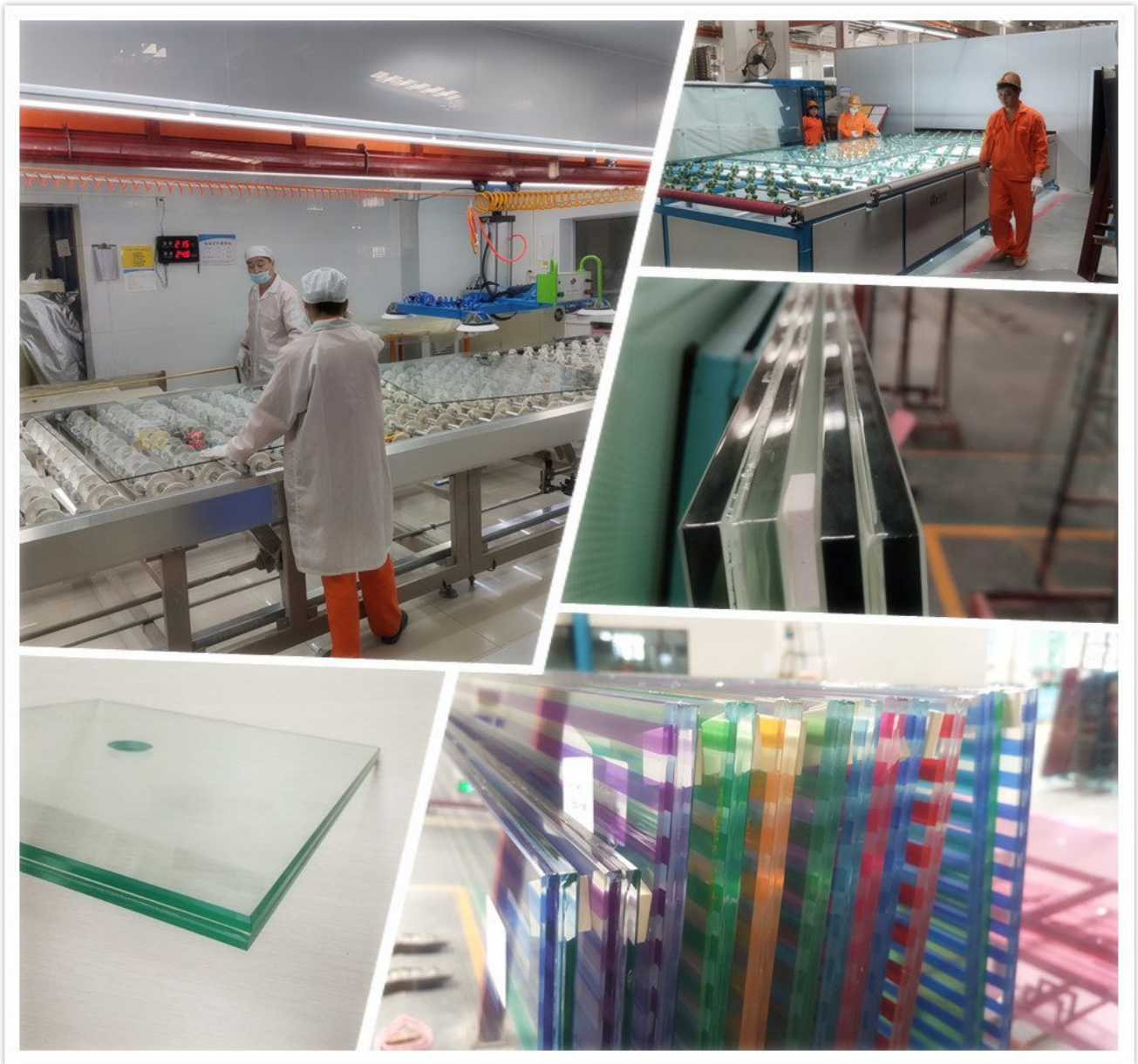
. Shenzhen Dragon Glass acoustic laminated glass products