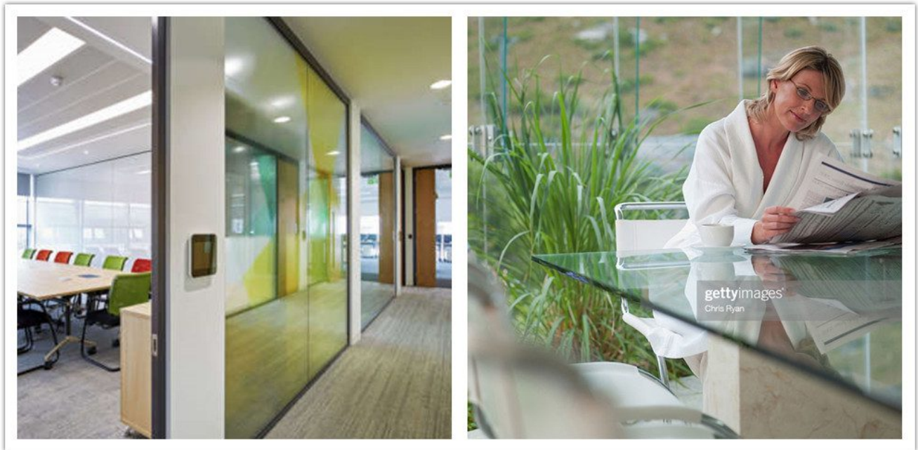
.Internal glass partition with acoustic designs

الزجاج مغلفة pvb الصوتية 6mm + 8mm+6 هو جيد جدا لأقسام الزجاج الداخلية لأنها يمكن أن تقلل من الضوضاء بأكثر من 37dB+. وهذا يعني أنه يمكنك التمتع بيئه صامته داخل المكتب ليس فقط للعمل ولكن أيضا عندما كنت يستريح لقراءة كتاب حتى خارج صاخبة جدا.