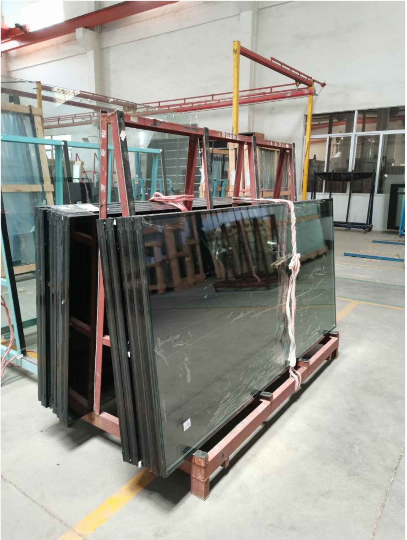
Strong plywood crate packing to avoid the damage of insulated .glass during long-distance transportation